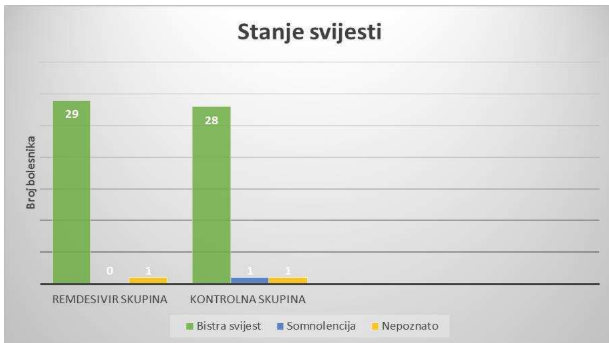
Slika 2. Prikaz stanja svijesti na hitnom infektološkom prijemu u 60 bolesnika liječenih na Klinici za infektologiju KBC-a Split zbog infekcije SARS-CoV-2 virusom u razdoblju od 1. sivbnja 2020. do 31. prosinca 2020.

Pri prvom pregledu na hitnom infektološkom prijemu, u remdesivir skupini 29 bolesnika je bilo bistre svijesti, za jednog bolesnika stanje svijesti nije poznato. U kontrolnoj skupini 28 bolesnika je bilo bistre svijesti, jedan je bolesnik bio somnolentan, a za jednog bolesnika stanje svijesti nije poznato (Slika 2).