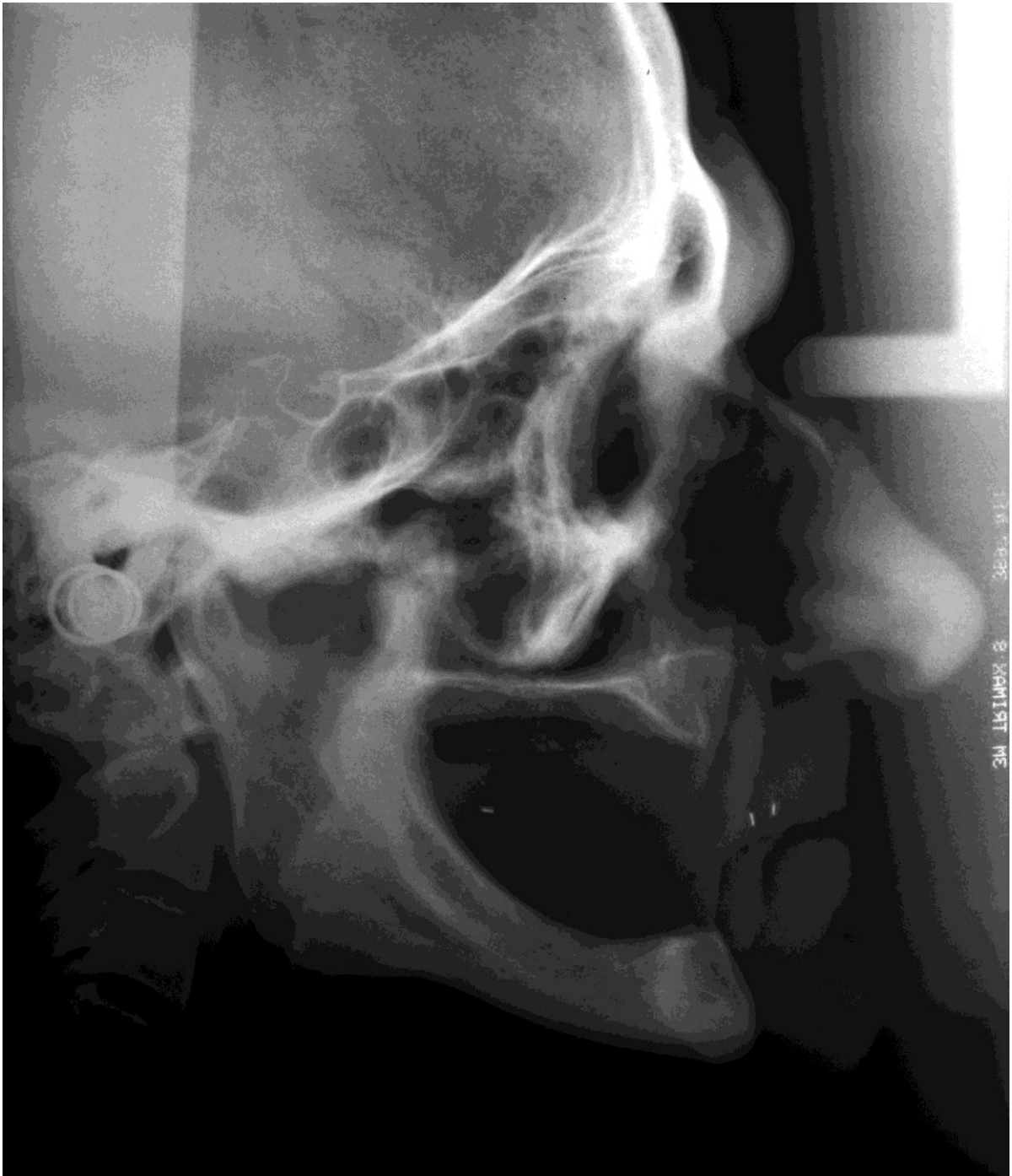
Slika 2. Lateralni kefalogram sa oznakama koje su se koristile za određivanje položaja okluzijske plohe na totalnim zubnim protezama