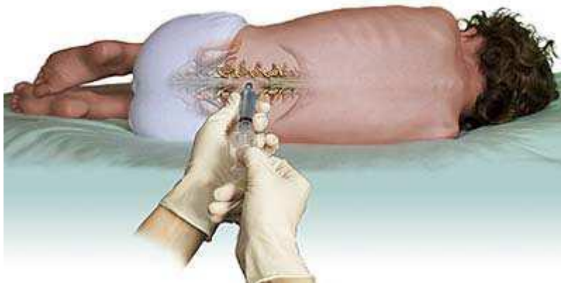
Slika 1. Izvođenje lumbalne punkcije

kralješka. Iznimno je važno bolesniku objasniti potrebu za maksimalno mogućim pregibanjem prema naprijed kako bi se trnasti nastavci susjednih kralježaka razmaknuli. To se postiže postavljanjem bolesnika u supinirani bočni položaj (lijevi ili desni), savijajući vrat tako da ako je moguće brada dodiruje prsa, nogu flektiranih u kukovima i koljenima te maksimalno približenih trbuhu tako da se brada i koljena gotovo dodiruju. Pod glavu se postavlja jastuk kako bi mjesto punkcije bilo na nižem mjestu od moždanih komora. Ako se punkcija izvodi u sjedećem položaju, bolesnika se posjeda na rub kreveta što bliže liječniku, maksimalno flektirane glave prema prsnom košu. Nakon što se osjeti karakteristično „probijanje” dure i ulazak u subarahnoidni prostor mandren igle se može izvući, no vrlo polako kako se ne bi zajedno s likvorom „usisao” i korijen spinalnog živca uzrokujući radikularnu bol. Iradijacija boli duž ishijadičnog živca obično znači da je insercija igle učinjena previše postranično, te je liniju insercije preporučljivo ispraviti. Položaj igle obvezno se ispravlja s mandrenom unutar punkcijske igle, a bolesnik se ne smije pomicati. Iako je „suha punkcija”, tj. izostanak istjecanja likvora unatoč naizgled pravilnom položaju punkcijske igle pokatkad posljedica obliteracije subarahnoidnog prostora kompresivnim promjenama ili adhezivnim arahnoiditisom, ipak se to češće događa zbog nepravilnog mjesta postavka igle za lumbalnu punkciju (14).