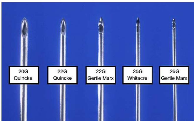
Slika 2. Najčešće korišteni tipovi igala za lumbalnu punkciju