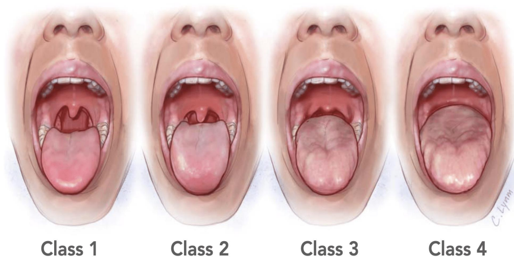
Slika 2. Mallampati klasifikacija. Preuzeto iz (30).

Mallampati klasifikacija prikazana na Slici 2 jedna je od metoda pomoću koje se procjenjuje relativna veličina baze jezika u odnosu na orofarinks kako bi se mogle predvidjeti potencijalne poteškoće pri endotrahealnoj intubaciji (29). Danas se koristi modificirana Mallampati klasifikacija (29).