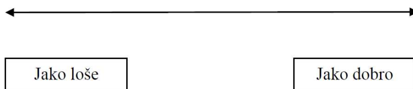
Slika 1. VAS ljestvica za procjenu zadovoljstva starom potpunom protezom.

Na VAS ljestvici ispitanici su iskazali svoje zadovoljstvo starom potpunom protezom, označavanjem tako da su označili okomitu crtu na 100 mm dugačkoj ljestvici (Slika 1).