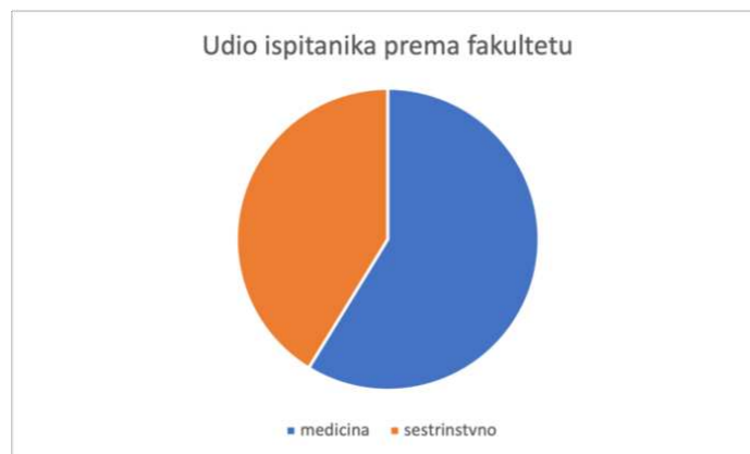
Slika 2. Udio ispitanika prema fakultetu

Gotovo četiri petine ispitanika bilo ženskog spola (n=189), dok je 20,6% ispitanika u istraživanju bilo muškog spola (n=49) (Slika 3).