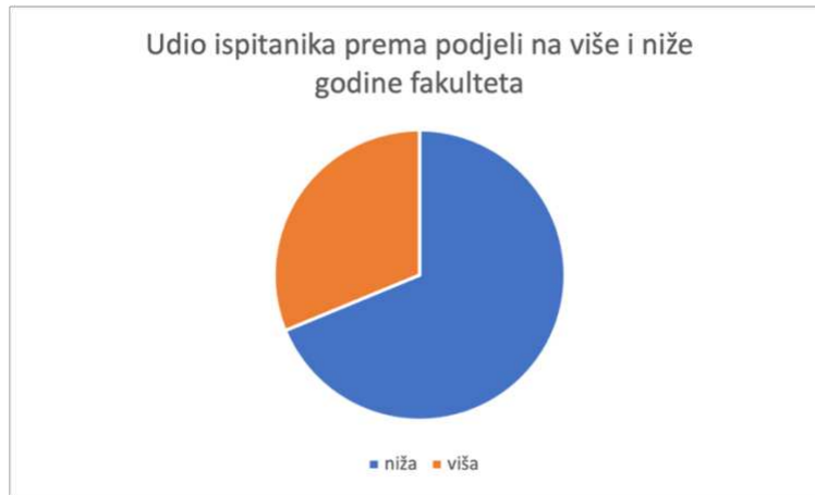
Slika 4. Udio ispitanika po godini fakulteta. Podjela na više i niže godine studija.