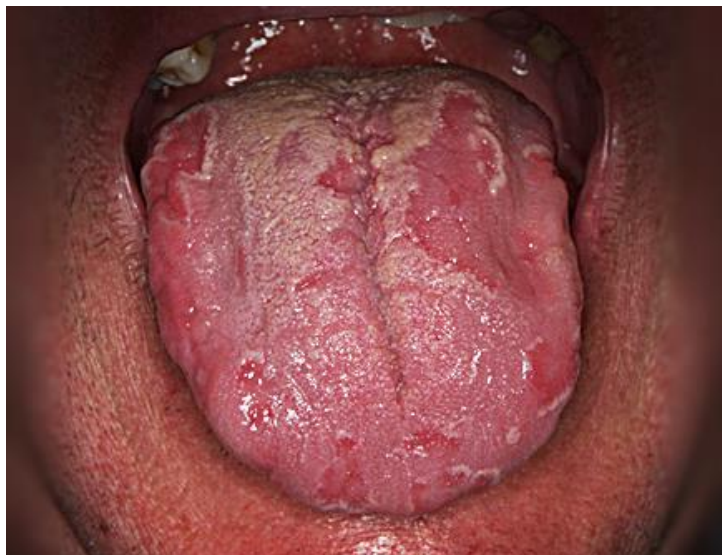
Slika 1. Klinički izgled geografskog jezika.

Geografski jezik ( erythema migrans , erythema areata migrans , glossitis areata migrans , glossitis areata exfoliativa ) je dobroćudno stanje koje primarno zahvaća gornju površinu jezika, ali može zahvatiti i rubove, kao i donju stranu jezika. Obilježeno je prstenastim, kružnim ili zavojitim lezijama s blago udubljenim atrofičnim središtem (bez filiformnih papila) i uzdignutim bijelim rubovima koje čine obnovljene filiformne papile te mješavina keratina i neutrofila (1). Lezije su oštro ograničene i mogu varirati u veličini od nekoliko milimetara do nekoliko centimetara (Slika 1). Geografski jezik karakteriziraju razdoblja egzacerbacije i remisije. Tijekom remisije, lezije cijele bez ožiljka, dok je razdoblje egzacerbacije karakterizirano pojavom lezija na različitim mjestima zbog čega se još i naziva migrirajući glositis . Geografski jezik je najčešće asimptomatski. Ponekad se mogu javiti simptomi poput pečenja i boli, naročito nakon konzumacije određene hrane i alkoholnih pića (2). Promjene na jeziku mogu biti udružene s lezijama sličnog izgleda na nepcu, sluznici obraza ili gingive pa se takvo stanje naziva erythema circinata migrans ili ektopični geografski stomatitis (1,3).