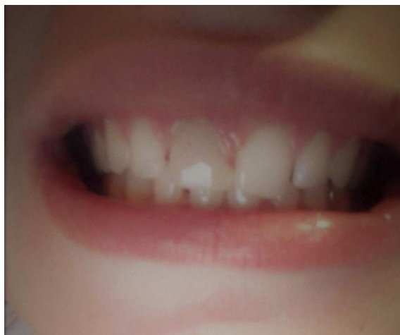
Slika 2. Komplicirana fraktura krune na zubu 11 uslijed zadobivenog udarca laktom tijekom rukometne utakmice.