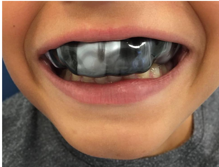
Slika 3. Individualni dentalni štitnik PlaysafeTriple (ERKODENT ErichKoppGmbH, Pfalzgrafeweiler, Njemačka) u mladog vaterpoliste

materijala i preciznosti kojom se rade, smatraju se napravom izbora za profesionalnu zaštitu oralnih struktura u sportaša i, iako je to daleko najskuplja opcija, literatura ukazuje na to da pružaju najbolju retenciju i ugodnost nošenja, manje interferiraju s govorom i disanjem i bolje se adaptiraju u ustima (27, 28, 41-43)(Slika 3).