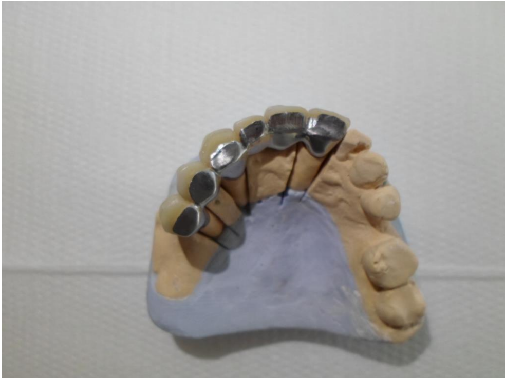
Slika 4. Fasetirani keramički fiksni most na sadrenom modelu

Iako mobilne proteze zbog umanjene kvalitete života i velike potrebe za naknadnim intervencijama u usporedbi s fiksnim nadomjescima nisu uvijek najbolje rješenje, one imaju određenu prednost, osobito kad se radi o djelomičnim protezama koje se u slučaju gubitka zuba nosača mogu jednostavnim i jeftinim zahvatom prilagoditi novonastaloj situaciji, dok krunice i mostovi gubitkom nosača u potpunosti gube funkciju (2).