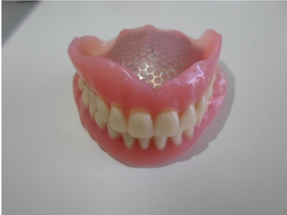
Slika 1. Gornja i donja totalna proteza u kontaktu izvan usne šupljine

Kombinirani radovi nude razne kombinacije ovisno o veznom sustavu. Vezni sustav može biti kuglica, prečka ili slično, no uvijek se sastoji od matrice i patrice. Patrica je najčešće dio fiksnog protetskog rada, a odgovarajuća matrica se nalazi u sklopu mobilne proteze (iako može biti i obrnuto). Postoji velik broj različitih sustava, a njihov izbor ovisi o konstrukciji proteze. Zbog prijenosa dijela opterećenja na zube, baza djelomične proteze može biti manja od baze potpune proteze. Dakle, baza djelomične proteze je manjih dimenzija, a uz to podnosi veće sile. To joj omogućava metalni kostur koji ojačava protezu i sprečava pucanje gracilne baze do kojeg bi moglo doći djelovanjem velikih žvačnih sila. Proteza smanjene baze pacijentu je ugodnija za nošenje jer priliježe uz manju površinu sluznice. Također manje smeta pri govoru, a zbog veće stabilnosti ugodnija je za žvakanje. Različiti oblici djelomične proteze zahtijevaju određeni period prilagodbe i navikavanja. Moderna stomatološka protetika nudi i kombinaciju mobilnih i fiksnih radova na zubnim implantata koji pokazuju dobre rezultate i dugotrajnost uz desetogodišnje održavanje implantata u usnoj šupljini u 93,4 % slučajeva (4).