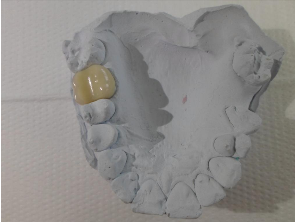
Slika 2. Samostalna metal-keramička krunica na sadrenom modelu

Danas na tržištu postoji velik broj materijala iz kojih mogu biti izrađeni protetski nadomjesci. Svi se oni mogu svrstati u dvije osnovne skupine: nemetale (umjetne smole) i metale (plemenite i neplemenite) (5). Koji materijal će se u određenog pacijenta koristiti ovisi o indikaciji, stručnosti stomatologa i tehničara, opremljenosti laboratorija i financijskim mogućnostima. Akrilni plastični materijali su u svakodnevnoj protetskoj praksi najbolje prihvaćeni te se najčešće koriste (5). Smatra se kako polimeri čine 95 % materijala korištenih u stomatološkoj protetici (5). Neplemeniti metali kvalitetom ne zaostaju za plemenitim metalima, a značajno su jeftiniji te su gotovo izbacili iz primjene plemenite metale. Razvojem stomatološke znanosti i struke u 20. je stoljeću pronađen niz novih materijala i tehnika koje su unaprijedile klinički rad, osobito u fiksnoj protetici (5). Pojavljuje se dentalna keramika, materijal koji se prema svom sastavu (glinica, kvarc i kaolin) i svojstvima svrstava između tvrdog porculana i običnog stakla. Ne može se opisati kao porculan stoga što nedostaju tipični kristali koji su svojstveni tvrdom porculanu (militi), a isto se tako ne može svrstati u staklo jer pokazuje djelomice kristalnu strukturu (najčešće leuciti), dok je pravo staklo potpuno amorfne građe (5).