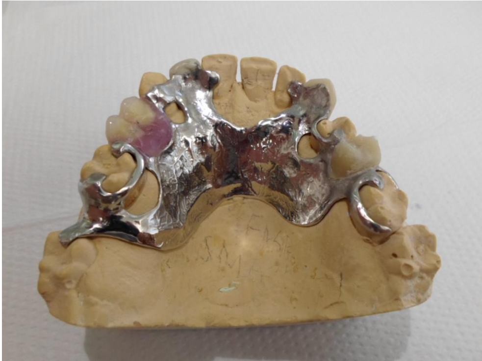
Slika 3. Metalni skelet za djelomičnu mobilnu protezu s metalnom bazom na sadrenom modelu.

Usavršavanjem keramičkih sustava pronađena je jedinstvena kombinacija potrebnih svojstava kao što su biokompatibilnost, stabilnost i trajnost uz odlična optička svojstva te su zato značajno umanjili upotrebu akrilata u fiksnoj protetici.