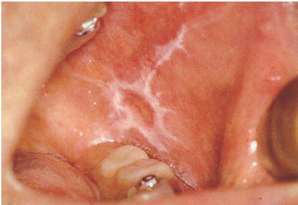
Slika 1. Retikularni oblik OLP-a na obraznoj sluznici. Preuzeto iz (17).