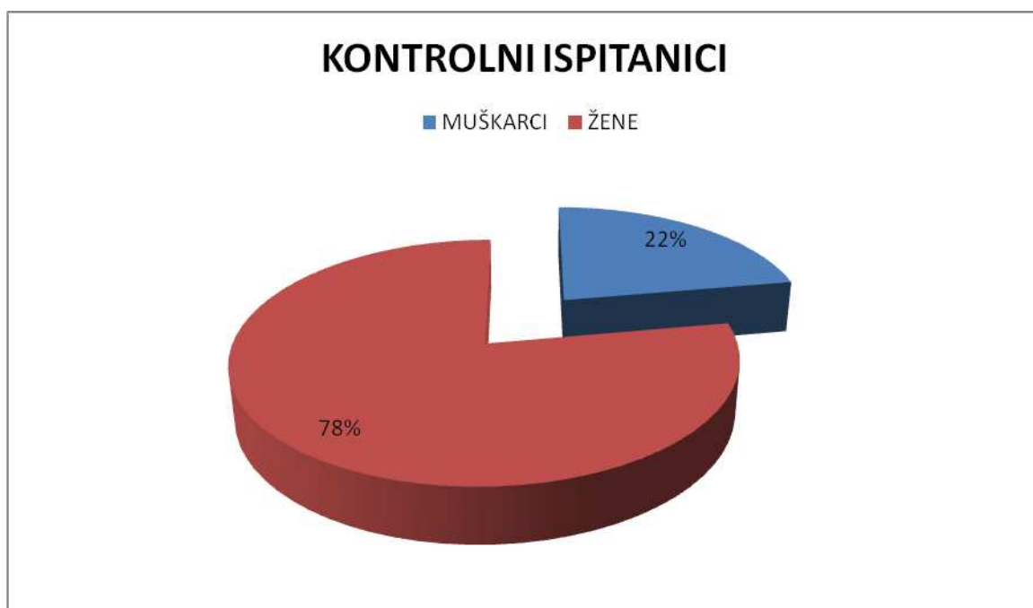
Slika 3. Spolna struktura ispitanika kontrolne skupine.

Srednja dob ispitanika bila je ista u obje skupine (62 godine). Raspon godina kretao se od 40 do 80 u ispitnoj, te od 40 do 81 u kontrolnoj skupini. Razlika u dobi između ispitivanih skupina nije bila statistički značajna ( P = 0,819 ).