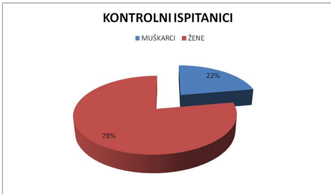
Slika 3. Spolna struktura ispitanika kontrolne skupine.

Srednja dob ispitanika bila je ista u obje skupine (62 godine). Raspon godina kretao se od 40 do 80 u ispitnoj, te od 40 do 81 u kontrolnoj skupini. Razlika u dobi između ispitivanih skupina nije bila statistički značajna ( P = 0,819 ).