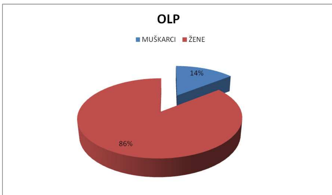
Slika 2. Spolna struktura ispitanika s OLP-om.

Među ispitivanim skupinama nije bilo statistički značajne razlike s obzirom na spol ispitanika ( P = 0,248 ).