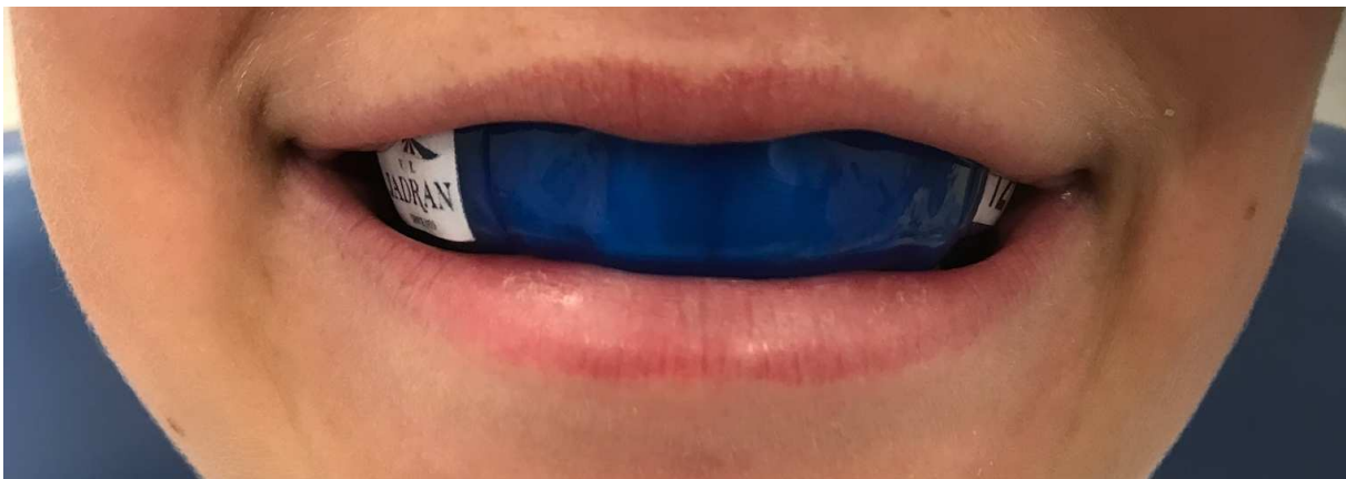
Slika 2. Individualni dentalni štitnik PlaysafeTriple (ERKODENT Erich Kopp GmbH, Pfalzgrafeweiler, Njemačka).

Konfekcijski štitnici su komercijalni pripravci široke primjene, ali su najlošiji i najneučinkovitiji. U prodaju dolaze u različitim oblicima i veličinama te se upotrebljavaju u obliku u kojem su kupljeni (14, 33, 34). Poluprilagodljivi štitnici dostupni su u dva oblika: jedan od njih je “ shell liner ” koji labavo pristaje preko zubi (33, 34). Ta podvrsta poluprilagodljivog štitnika manje je dostupna i obično glomaznija od “ boil and bite ” podvrste. “ Boil and bite ” podvrsta je najčešće korišteni i najprodavaniji tip dentalnog štitnika. Napravljen je od termoplastičnog materijala i izrađuje se na način da ga se omekša u vrućoj vodi, kratko ohladi u hladnoj vodi, stavi u usta i modelira uz pomoć prstiju, jezika i zagriznog pritiska kako bi se formirao stabilan otisak (32-34). Potpuno prilagodljivi štitnici pružaju najbolju vrstu zaštite. Izrađeni su u stomatološkim ambulantom ili dentalnim laboratorijama prema uputama doktora dentalne medicine i potpuno su prilagođeni osobama koje ih nose (35, 36). Ta vrsta štitnika osigurava najbolji sklad sa zubnim lukom i literatura ukazuje na to da pružaju najbolju retenciju i ugodnost nošenja, manje interferiraju s govorom i disanjem i bolje se adaptiraju u ustima (Slika 2) (33, 34).