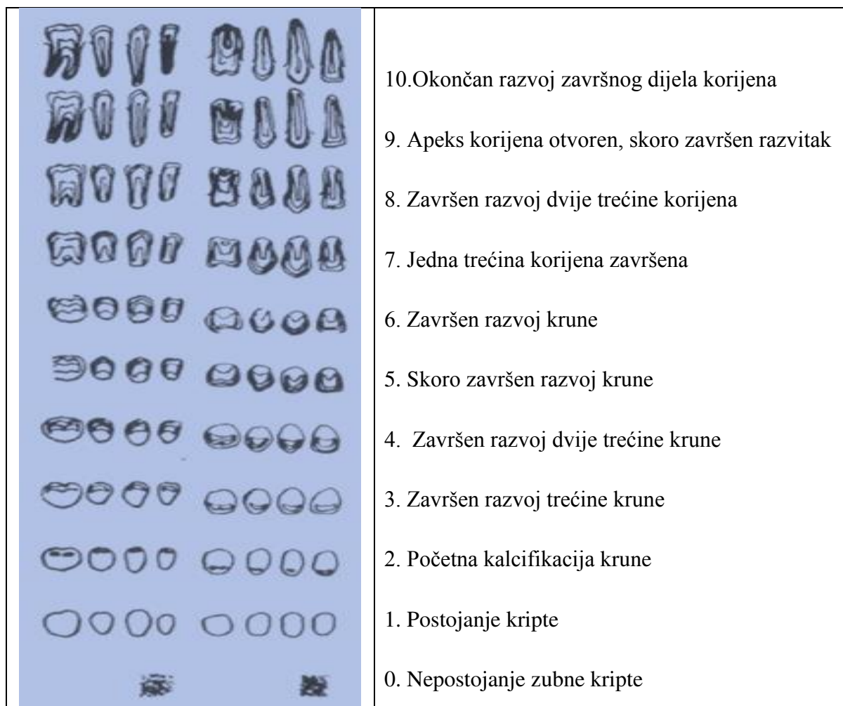
Slika 3. Stadiji razvoja mandibularnih i maksilarnih zuba. Preuzeto i prilagođeno prema (15).

Sukladno izvornom članku, Nolla metode su osmišljene tako da se mogu provoditi na dva različita načina (15). Jedan od njih uključuje sve gornje i donje zube jedne strane lica, ali ne uključuje treće kutnjake i to je NOL7 metoda, dok drugi uključuje sve zube kao i kod metode NOL7, ali i treće kutnjake ili NOL8 metoda. Ove metode se koriste za promatranje i identifikaciju stadija mineralizacije zubi na temelju referentne tablice. Kod ove metode su se nakon klasifikacije svakog zuba, faze zbrajale te su se rezultati promatrali prema referentnoj tablici za procjenu dentalne dobi (15). Nolla metode (sa i bez trećih kutnjaka) se smatraju subjektivnim metodama.