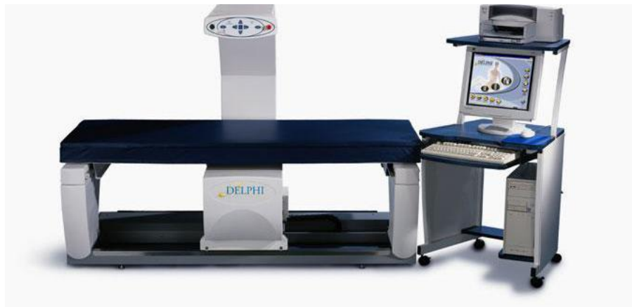
Slika 3. Uređaj za mjerenje mineralne gustoće kosti dvoenergetskom apsorpcijometrijom

Zlatni standard u dijagnostici osteoporoze jest denzitometrija ili DXA (dvoenergetska apsorpcijometrija X zraka, engl. Dual Energy X-ray Absorptiometry )) kojom se određuje BMD (Slika 3) (35).