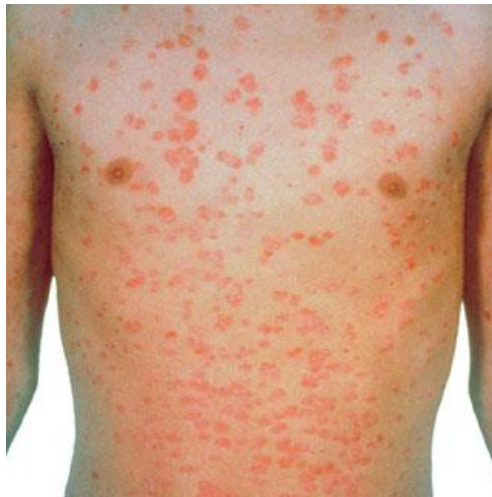
Slika 2. Psoriasis guttata