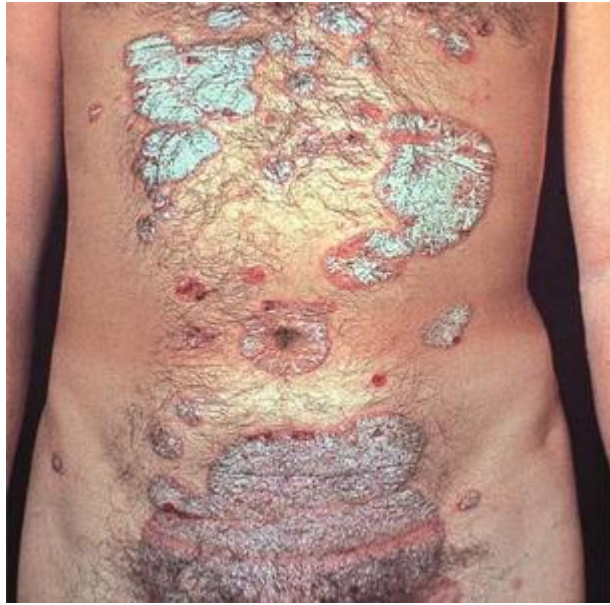
Slika 1. Psoriasis vulgaris