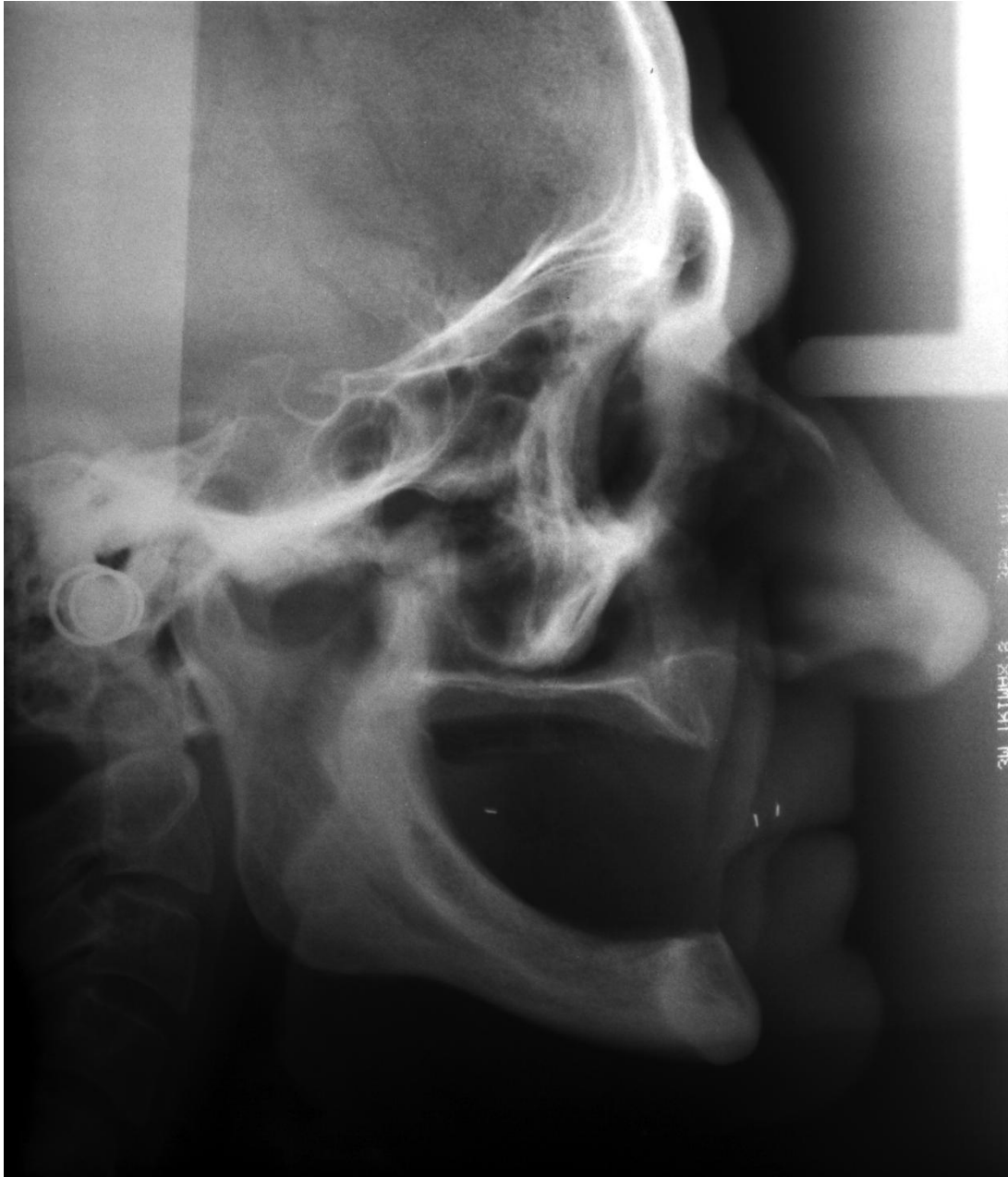
Slika 1. Lateralni kefalogram snimljen svakom pacijentu prilikom predaja proteza i nakon petogodišnjeg nošenja