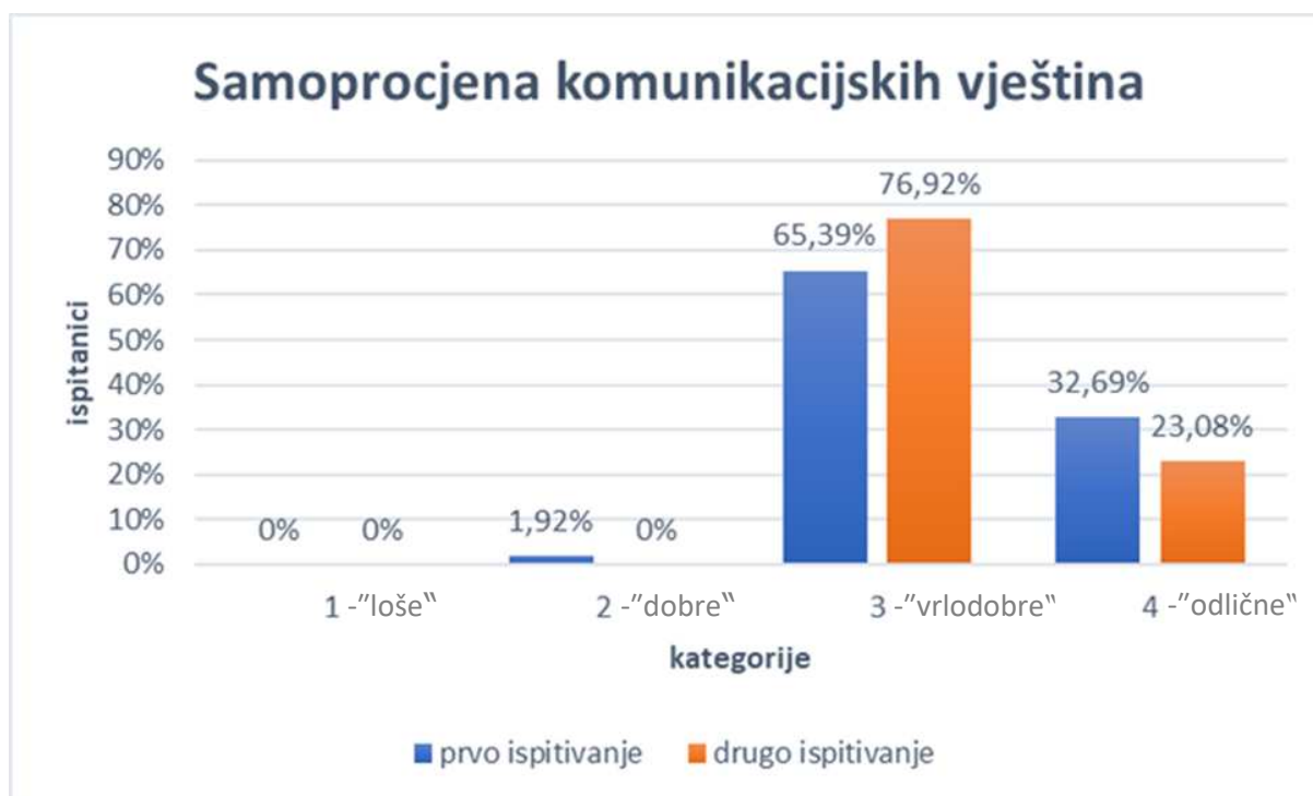
Slika 1. Samoprocjena komunikacijskih vještina