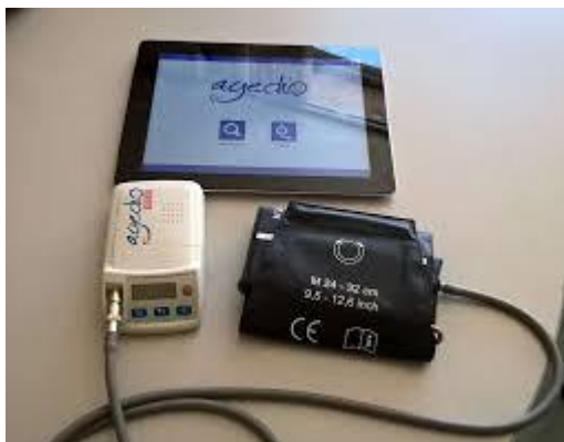
Slika 4. Uređaj „Agedio B900“ za mjerenje tlaka umrežen s tabletom

uređaja „Agedio B900“ zbog nemira bolesnika ili postojeće aritmije), izmjerene vrijednosti perifernog tlaka su uzete mjerenjem živinim tlakomjerom.