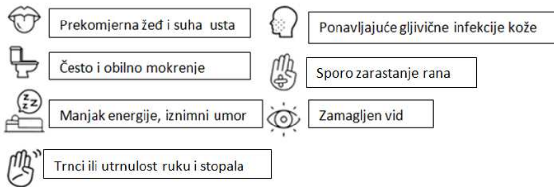
Slika 2. Simptomi šećerne bolesti tipa 2. Prilagođeno na temelju izvorne slike: International Diabetes Federation. IDF Diabetes Atlas, 8th edn. Brussels, Belgium: International Diabetes Federation, 2017. Dostupno na http://www.diabetesatlas.org

Nakon što koncentracija glukoze u krvi prijeđe renalni prag izlučivanja, uz hiperglikemiju se javlja glukozurija pa dolazi do jake osmotske diureze, odnosno navlačenja vode zbog osmotski aktivne tvari (glukoza), koja rezultira poliurijom (prekomjernim mokrenjem) (109). Poliurija rezultira velikim gubitkom tekućine što dovodi do polidipsije (pojačane žeđi) koja pokušava zaštititi organizam od dehidracije povećavajući potrebu za nadoknadom tekućine. Zbog glukozurije dolazi i do gubitka kalorija koji se pokušava kompenzirati pojavom polifagije (prejedanja).