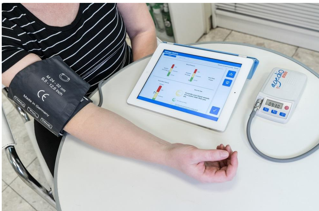
Slika 5. Mjerenje tlaka uz pomoć uređaja „Agedio B900“ uz prikaz izvješća za liječnika na tabletu

Uz ranije navedeno, za svakog ispitanika su zabilježene serumske vrijednosti hemoglobina (g/L), MCV-a (fL), ureje, kreatinina, glukoze u plazmi, albumina (g/L),