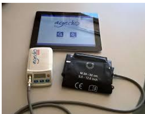
Slika 4. Uređaj „Agedio B900“ za mjerenje tlaka umrežen s tabletom

uređaja „Agedio B900“ zbog nemira bolesnika ili postojeće aritmije), izmjerene vrijednosti perifernog tlaka su uzete mjerenjem živinim tlakomjerom.