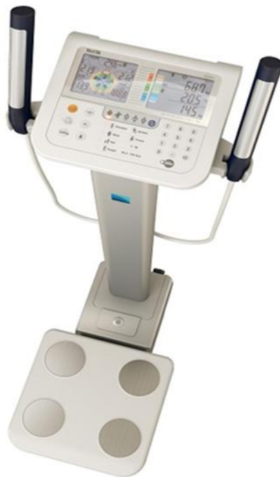
Slika 6. Tanita MC780 Multi Frequency segmentni analizator sastava tijela

Tanita MC780 Multi Frequency segmentni analizator sastava tijela u kombinaciji s interaktivnom konzolom zaslona i ugrađenom SD karticom omogućuje trenutnu analizu stanja zdravlja i fizičke spremne bolesnika i praćenja njihovog napretka tijekom vremena ( Slika 6 ).