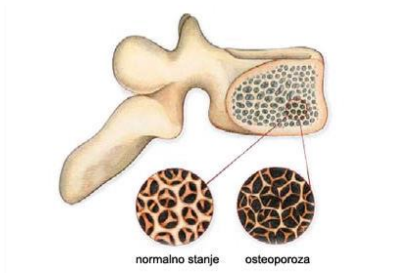
Slika 1. Izgled osteoporozom zahvaćene kosti.

50 godina, s potencijalno ozbiljnim i složenim posljedicama i povećanim rizikom od smrtnosti (14).