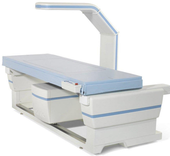
Slika 3. Denzitometrijski uređaj.

Obično se odrađuje na razini lumbalne kralježnice i proksimalnom femuru, rijede na distalnoj podlaktici (19). Prema kriterijima Svjetske zdravstvene organizacije BMD kuka je najpouzdaniji parametar za procjenu rizika za prijelom (24). On predstavlja količinu koštane mase u jedinici volumena (volumetrijska gustoća) mjerenu u \text{g}/\text{cm}^3 ili po jedinici površine (površinska gustoća) mjerenu u \text{g}/\text{cm}^2 (19).