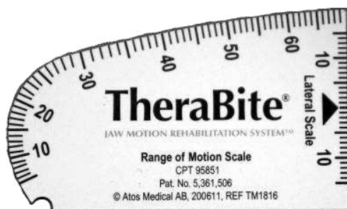
Slika 5. TheraBite mjerka za mjerenje interincizalne udaljenosti kod trizmusa. Preuzeto i obrađeno iz: (52)

Ograničeno otvaranje usta ili trizmus izmjereno je udaljenošću između incizalnih površina mandibularnog i maksilarnog središnjeg sjekutića pomoću ljestvice TheraBite (Atos Medical UK, Nottingham, Engleska) prije operativnog zahvata, prvi, drugi i treći postoperativni dan (Slika 5.).