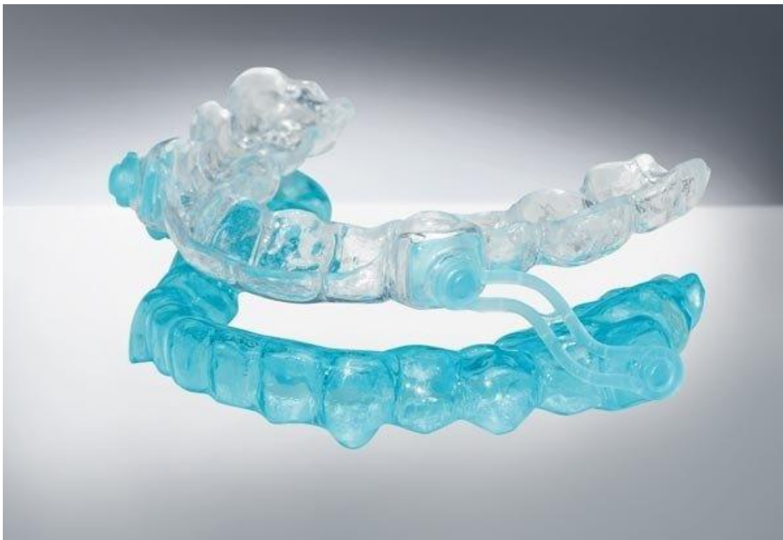
Slika 2. Silensor intraoralna udlaga za liječenje apneje. Preuzeto sa interneta: SleepPro. Dostupno na: https://www.sleeppro.eu/silensor-verstelbare-snurkbeugel.html .

prednji položaj (engl. Mandibular Advancement Device, MAD) i tzv. podizač jezika (engl. Tongue Retaining Device, TRD). Podizač jezika nije se pokazao učinkovitim u liječenju pacijenata s opstrukcijom apnejom, dok su MAD udlage danas sve više korištene kao terapijsko sredstvo u liječenju OSA (35). MAD udlage uzrokuju protruziju i stabilizaciju donje čeljusti kako bi osigurali prohodnost gornjih dišnih puteva (41). Postoje konfekcijske tzv. „boil and bite“ udlage koje su poluprilagodljive i nisu udobne za korištenje te individualne, prilagodljive „custommade“ udlage koje se izrađuju na temelju individualnog otiska gornje i donje čeljusti za svakog bolesnika (35). Uz podjelu na individualne i konfekcijske, MAD udlage mogu se podijeliti i na titracijske, s mehanizmom koji omogućava minimalni pomak pri protruziji donje čeljusti, te na udlage bez mogućnosti titracije, kod kojih je donja čeljust uvijek u istom položaju, a kao najučinkovitije su se pokazale udlage koje omogućuju titraciju tijekom liječenja (35).