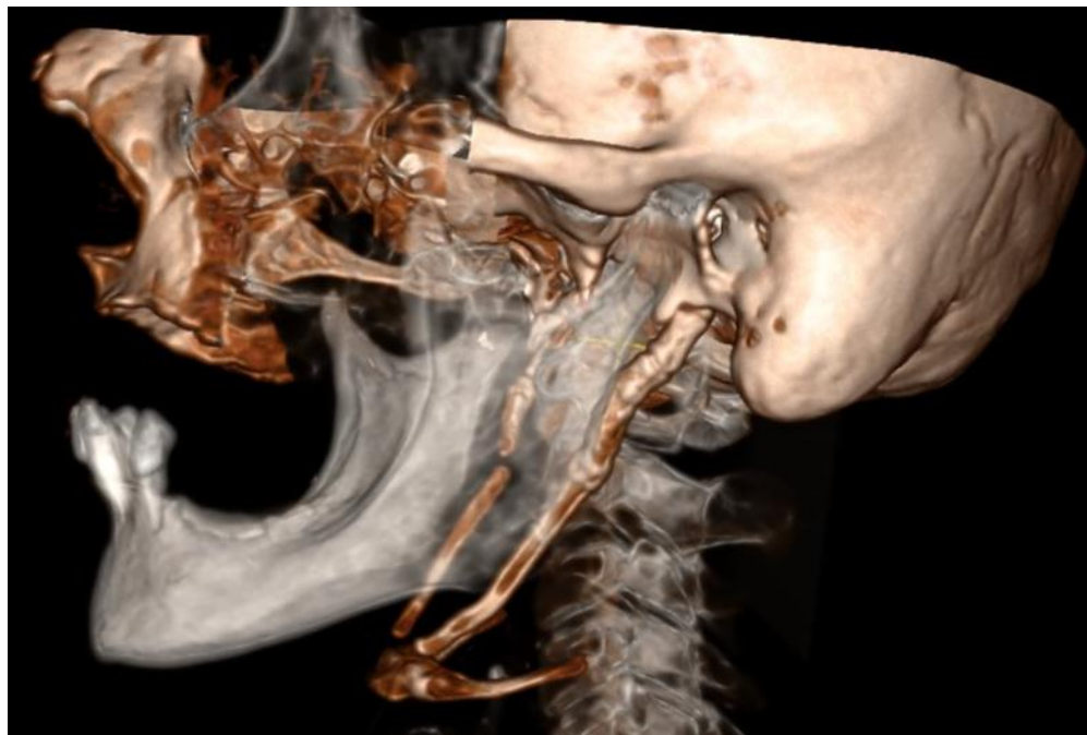
Slika 2. Obostrano produljeni stiloidni nastavak.