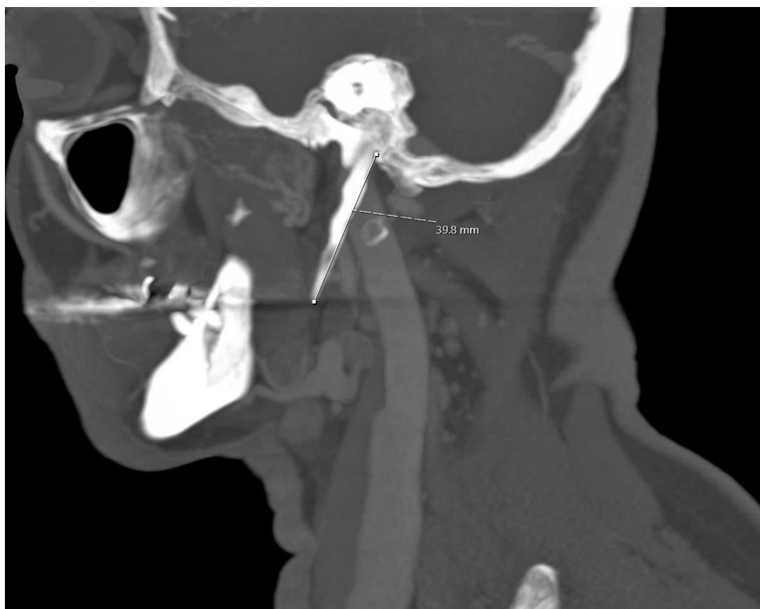
Slika 4. Način (tehnika) mjerenja duljine stiloidnog nastavka.

Duljina stiloidnog nastavka od spoja s temporalnom kosti do vrha, mjerena je pomoću radne stanice za analizu CT slika ( Sectra Workstation IDS7 verzija 23.2.0.5047, Teknikringen 20, Linköping, Švedska). U slučaju okoštavanja hrskavice stilohoidnog ligamenta ta je duljina dodana ukupnoj duljini nastavka (Slika 4).