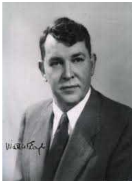
Slika 1. Dr. Watt Weems Eagle. Preuzeto iz (5).

Sindrom je dobio ime po Dr. Watt Weems Eagleu, američkom otorinolaringologu sa Sveučilišta Duke, koji je prvi put 1937. godine opisao simptome, dijagnozu i vrstu liječenja ovog stanja (1-4).