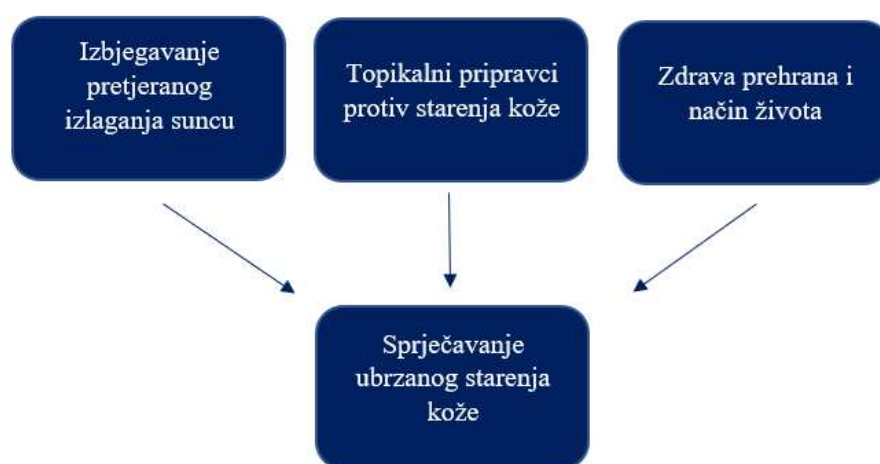
Slika 2. Shematski prikaz načina sprječavanja ubrzanog starenja kože (40).

Vitamin C snažan je antioksidans koji se u topikalnim pripravcima koristi kao zaštita od ultraljubičastog zračenja. Neutralizira slobodne radikale i sprječava razgradnju kolagena, kao i stvaranje pigmentacija (52).