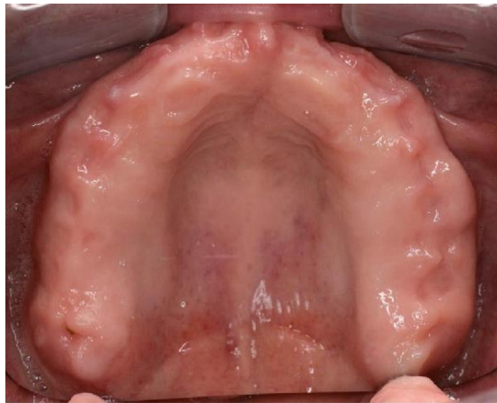
Slika 1. Ležište baze gornje proteze. Preuzeto: (7)

Koštana i meka tkiva čine ležišta potpunih proteza. Ležište baze gornje potpune proteze čine alveolarni greben, tvrdo nepce, tuber maxillae i crista zygomaticomaxillaris. Paratubarni prostor koji je smješten distalno od kriste izuzetno je važan za retenciju potpune proteze. Takvo tkivo odupire se djelovanju sila za vrijeme nošenja proteze i dobro podnosi opterećenje (2).