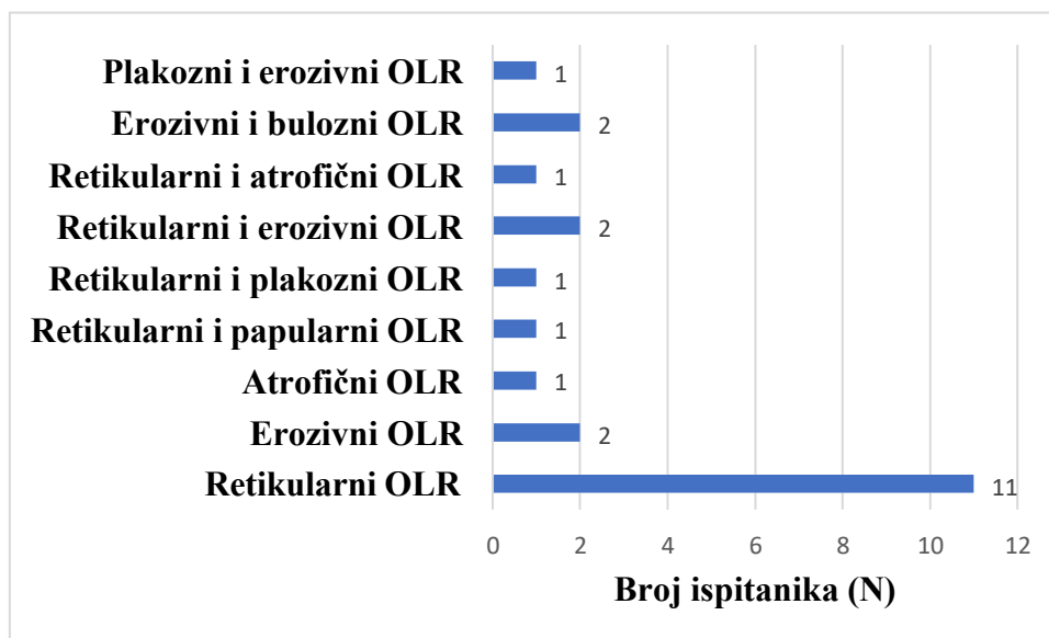
Slika 1. Raspodjela ispitanika prema kliničkom obliku OLR – a

Kod jednog ispitanika uočene su i kožne promjene koje odgovaraju kliničkoj slici lichen rubera. Nadalje, neki od ispitanika pokazuju više od jednog oblika OLR – a. Detaljna raspodjela koja taj podatak uzima u obzir prikaza je na Slici 1.