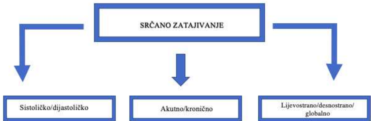
Slika 1. Podjela srčanog zatajivanja

Tradicionalno, sukladno nalazima ultrazvuka srca i istisne frakcije lijeve klijetke (LVEF), srčano zatajivanje možemo podijeliti na: sniženu sistoličku funkcija lijeve klijetke (HFrEF, LVEF \leq 40\% ), blago sniženu (HFmEF, LVEF 41-49%), i očuvanu (HFpEF, LVEF \geq 50\% ).