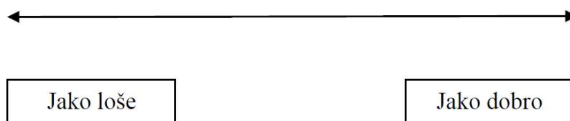
Slika 1. VAS ljestvica za procjenu boli.

U istraživanju su sudjelovali dobrovoljni ispitanici kojima je u ambulanti za stomatološku protetiku Stomatološke poliklinike Split prethodno dijagnosticiran TMP. Na poziv za sudjelovanje u istraživanju odazvala su se 34 ispitanika. Nakon kliničkog pregleda koji je potvrdio prisutnost simptoma TMP-a (ograničeno otvaranje usta, devijacija mandibule prilikom otvaranja usta, glavobolja, škljocanje) ispitanici su ispunili anketni upitnik o dobi, spolu i stručnoj spremi te zdravlju, a nakon toga upitnik o kvaliteti života SF-36 koji mjeri subjektivni osjećaj zdravlja kroz osam domena/kategorija zdravlja (tjelesno funkcioniranje, ograničenja u ostvarivanju životnih uloga zbog tjelesnih poteškoća, ograničenja u ostvarivanju životnih uloga zbog emocionalnih problema, društveno funkcioniranje, psihičko zdravlje, vitalnost, tjelesni bolovi, percepcija općeg zdravlja), upitnik za procjenu kvalitete života ovisne o oralnom zdravlju OHIP-14 te su na VAS ljestvici označavanjem procijenili svoju bol tako da su označili okomitu crtu na 100 mm dugačkoj ljestvici (Slika 1) (23).