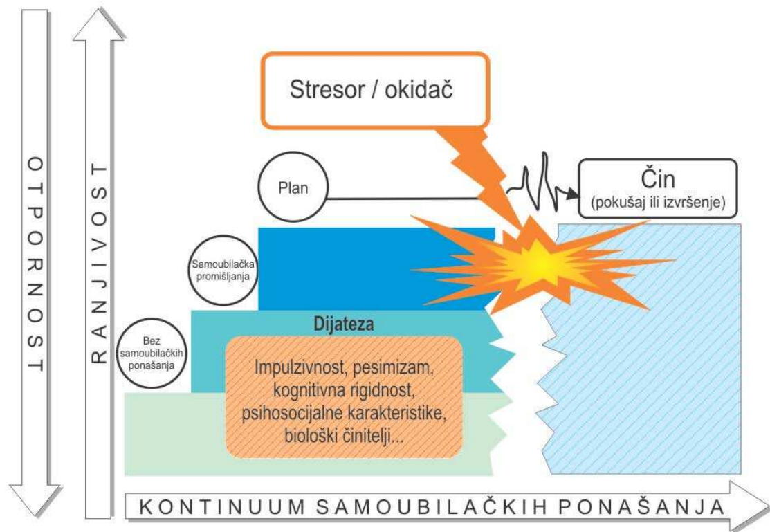
Slika 1 Prikaz dijateza-stres modela suicidalnog ponašanja (Prema Holmes i Rahe, 1967)