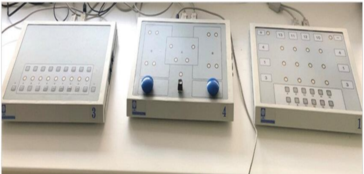
Slika 1. Complex Reactionmeter Drenovac (CRD-serija) psihodijagnostički testovi, CRD 311 lijevo, CRD 411 u sredini i CRD 11 desno. (Preuzeto i prilagođeno prema: Pavlinac DI, Qazzafi A, Lusic KL, Demirovic S, Pecotic R, Valic M, Dogas Z. The associations between results in different domains of cognitive and psychomotor abilities measured in medical students. Brain Sci. 2023;3;85.)