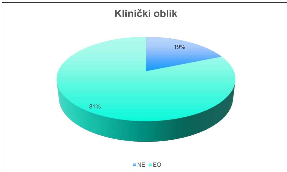
Slika 3. Udio pojedinog kliničkog oblika OLP-a.

Od 64 ispitanika, 12 (18,75%) njih je imalo neerozivni oblik OLP-a, dok je erozivni oblik imalo njih 52 (81,25%).