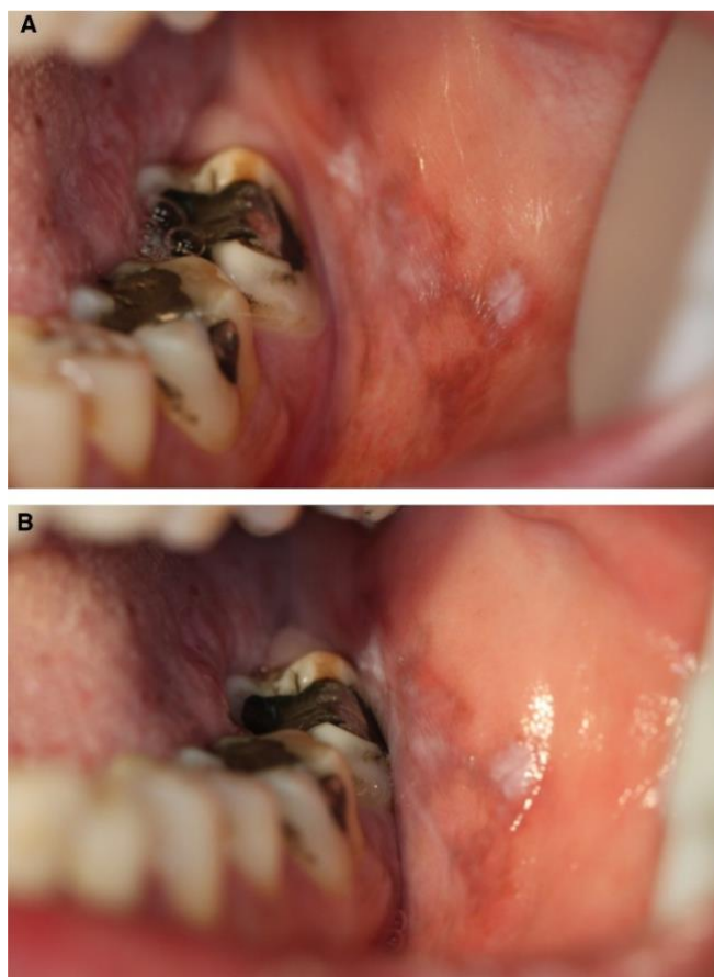
Slika 1. Lihenoidna reakcija-hiperkeratotični plakovi i strije na bukalnoj sluznici u neposrednoj blizini amalgamskog ispuna. Preuzeto iz (10).