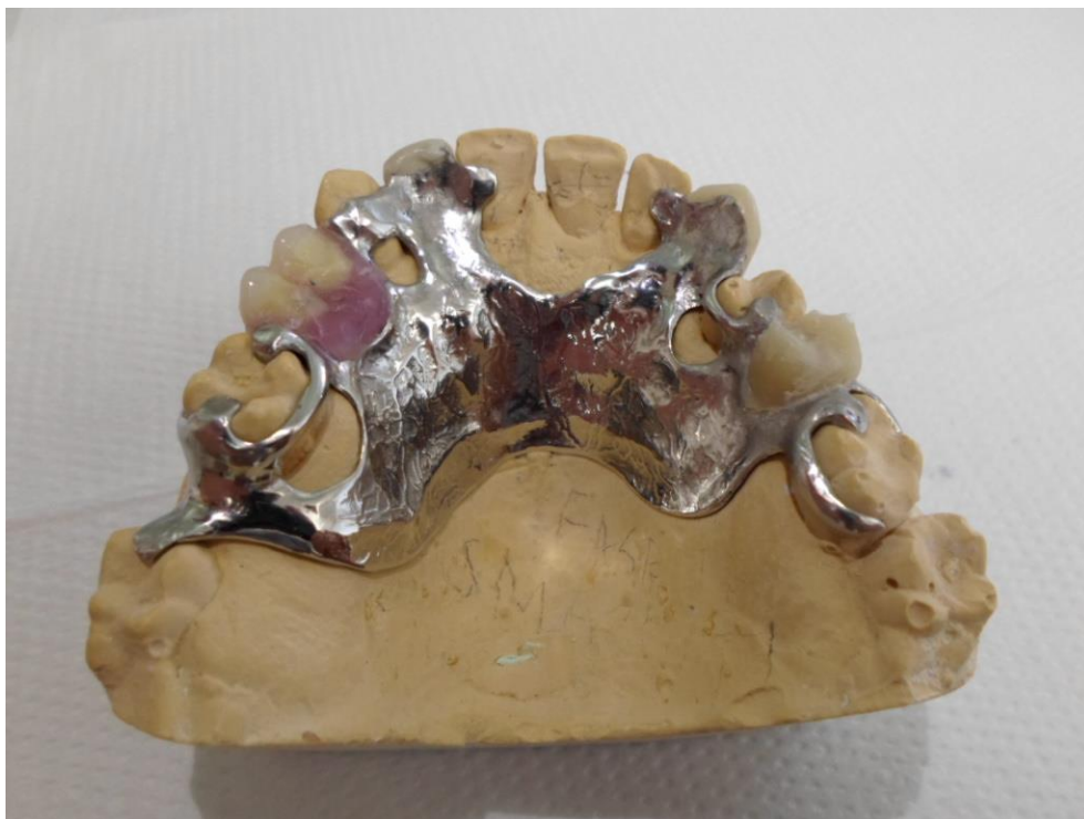
Slika 3. Metalni skelet za djelomičnu mobilnu protezu s metalnom bazom na sadrenom modelu.

Usavršavanjem keramičkih sustava pronađena je jedinstvena kombinacija potrebnih svojstava kao što su biokompatibilnost, stabilnost i trajnost uz odlična optička svojstva te su zato značajno umanjili upotrebu akrilata u fiksnoj protetici.