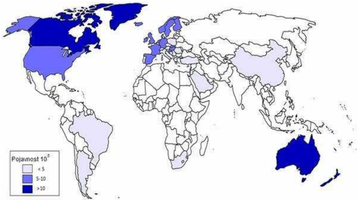
Slika 1. Globalna mapa pojavnosti Crohnove bolesti

od 0,08-0,5 na 100 000 stanovnika, dok Crohnove bolesti gotovo nema u Južnoj Americi i Africi. Ipak, u interpretiranju ovih podataka treba uzeti u obzir i smanjen pristup zdravstvenoj njezi u nekim djelovima svijeta, što može utjecati na izračun incidencije u tim područjima. U zapadnoj Europi i Sjevernoj Americi stope incidencije i prevalencije rastu brže kod Crohnove bolesti nego ulceroznog kolitisa. U djelovima svijeta u kojima je incidencija promatrana kroz duži vremenski period, uočen je značajni porast incidencije Crohnove bolesti u periodu od sredine 1950-ih do ranih 1970-ih. Ovaj trend najbolje je uočen u Danskoj i Sjedinjenim Američkim Državama. Većina studija diljem svijeta pokazale su veću učestalost Crohnove bolesti u žena i to u omjeru 1,2:1. Crohnova bolest najčešće se dijagnosticira u dobi od 15-30 godina, s medijanom otkrića u tridesetoj godini života, iako se bolest može pojaviti u bilo kojoj životnoj dobi. Što se tiče obiteljske aglomeracije bolesti, uočeno je da će od 2 do 5% osoba oboljelih od Crohnove bolesti imati jednog ili više srodnika koji će oboljeti od IBD (4).