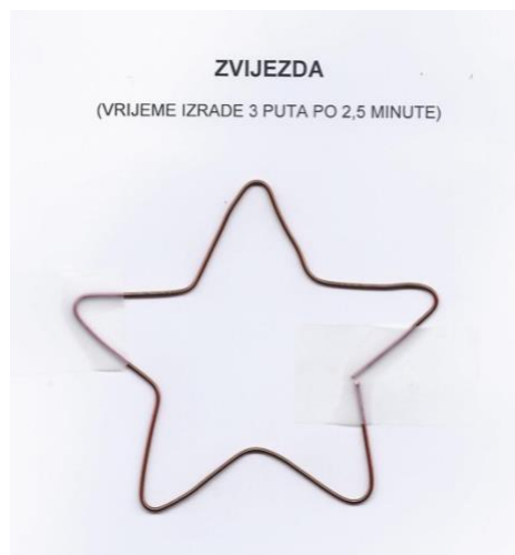
Slika 1. Zvijezda. Preuzeto iz (14).

Prilikom ispitivanja psihomotoričkih sposobnosti za upis na Studij dentalne medicine Medicinskog fakulteta Sveučilišta u Splitu, kandidat rješava tri testa, od kojih jedan test služi za provjeru prostorne percepcije oblika i veličine, a druga dva za provjeru ručne brzine i vještine. Ukupno zajedničko vrijeme provedbe testova iznosi 75 minuta, a maksimalni rezultat koji se može postići iznosi 100 bodova. Test prostorne percepcije oblika i veličine sastoji se od spajanja zadanog predloška s odgovarajućim, prostorno drugačije raspoređenim objektima različite veličine i oblika. Prvi test za provjeru ručne brzine i vještine sastoji se od tri bakrene žice veličine 1 mm i duljine 25 cm od kojih kandidat treba što preciznije reproducirati zadani oblik prikazan na predlošku u određenom vremenskom razdoblju. Postoje četiri moguća predloška (ključ, zvijezda, dvostruka strelica, mnogokut) od kojih se može pojaviti samo jedan (Slika 1, Slika 2).