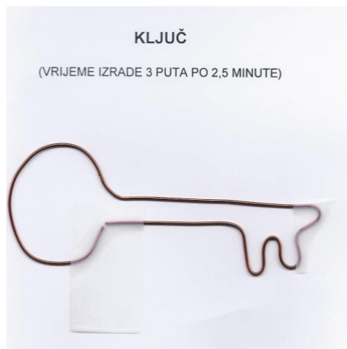
Slika 2. Ključ. Preuzeto iz (14).

Drugim testom, kojim se provjerava ručna brzina i vještina, ispituje se brzina popunjavanja ploče s 10 x 10 rupica metalnim čavličima. Kandidat dominantnom rukom uzima dva čavlića i nastoji redom što učinkovitije popuniti rupice. Bodovi se dobivaju na temelju brzine i učinkovitosti popunjenih rupica (Slika 3) (15).