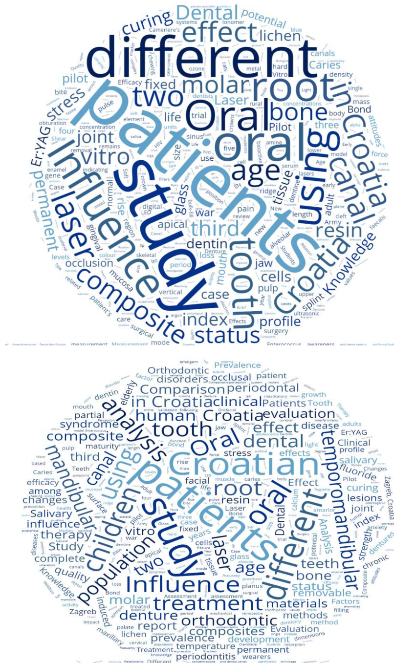
Slika 2. Oblak riječi sastavljen od riječi naslova analiziranih znanstvenih članaka, a) izvorni oblik, b) uklonjene sve riječi koje se pojavljuju tri ili manje put

Korištenjem broja riječi iz naslova kao mjere za najčešće istraživane teme ukazalo je na postojanje ukupno 5740 riječi u analiziranim naslovima. Među najčešćim pojmovima bili su oni vezani uz Hrvatsku, bolesnike i metode istraživanja (Slika 2a). Detaljnija analiza, uz isključenje najrjeđih riječi, dala je još nešto jasniju sliku (Slika 2b). Sužavanje rezultata samo na pojmove iz područja dentalne medicine uputilo je na vodeće teme istraživanja (Tablica 3).