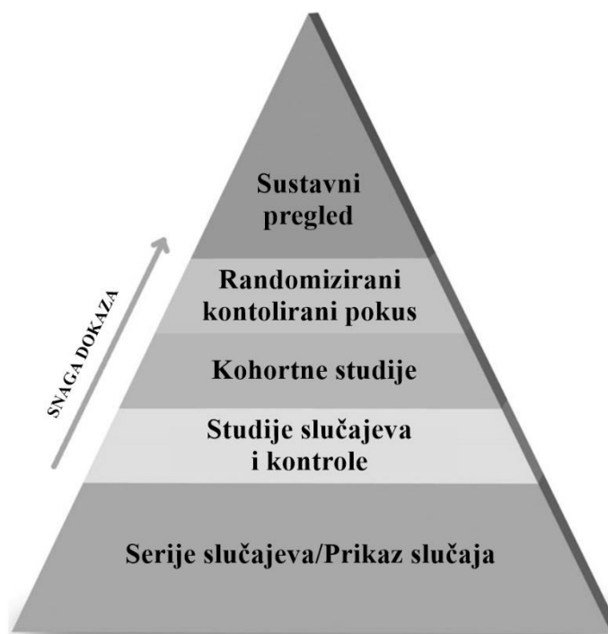
Slika 1. Piramida hijerarhije dokaza. Preuzeto i prilagođeno iz (8).

S obzirom na hijerarhijsku snagu dokaza, rezultati dobro provedenih randomiziranih kontroliranih pokusa prvi su sljedeći izvor dokaza pored sustavnih pregleda i meta-analiza (Slika 1) (8).