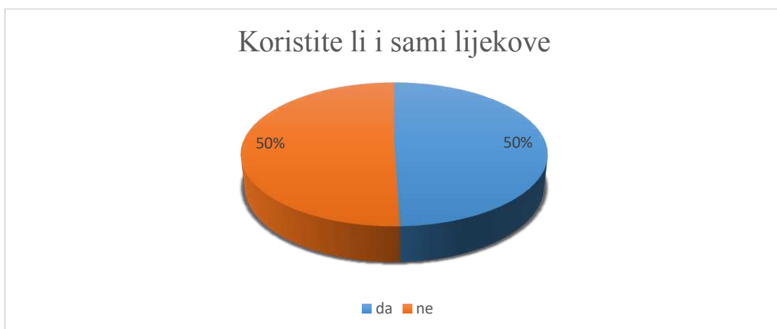
Slika 3. Udio studenata koji su koristili lijekove