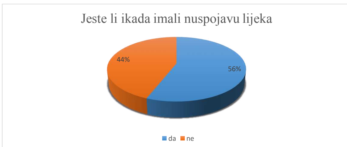
Slika 4. Udio studenata koji je imao nuspojavu lijeka