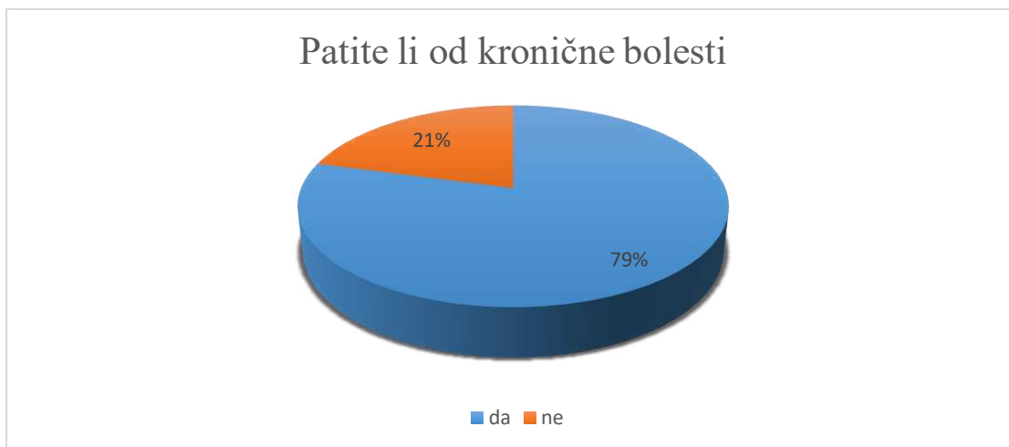
Slika 2. Udio studenata koji su patili od kronične bolesti