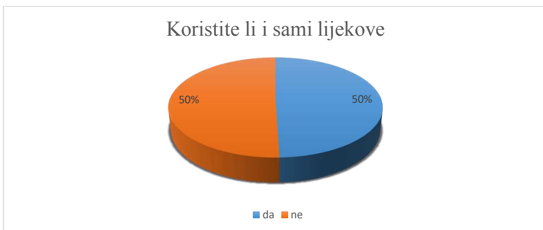
Slika 3. Udio studenata koji su koristili lijekove