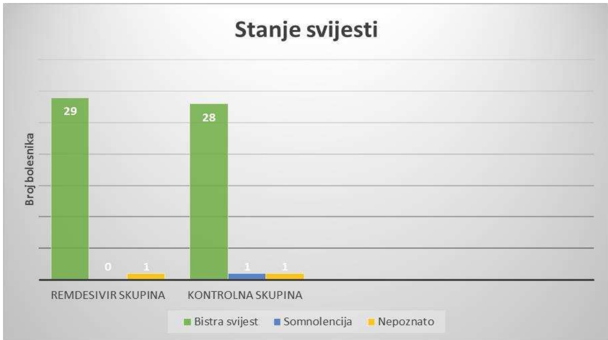
Slika 2. Prikaz stanja svijesti na hitnom infektološkom prijemu u 60 bolesnika liječenih na Klinici za infektologiju KBC-a Split zbog infekcije SARS-CoV-2 virusom u razdoblju od 1. svibnja 2020. do 31. prosinca 2020.

Pri prvom pregledu na hitnom infektološkom prijemu, u remdesivir skupini 29 bolesnika je bilo bistre svijesti, za jednog bolesnika stanje svijesti nije poznato. U kontrolnoj skupini 28 bolesnika je bilo bistre svijesti, jedan je bolesnik bio somnolentan, a za jednog bolesnika stanje svijesti nije poznato (Slika 2).