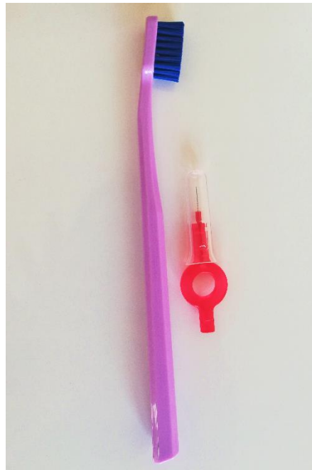
Slika 2. Četkica za zube i interdentalna četkica; osnovna sredstva za mehaničko uklanjanje supragingivnih naslaga plaka.

Osnovnim načinom sprječavanja nastanka parodontnoga oboljenja smatra se kvalitetno i pravilno mehaničko uklanjanje biofilma sa zubnih površina. U većini slučajeva će navedeno mehaničko čišćenje, koje podrazumijeva korištenje četkice, paste i interdentalnih četkica dva puta dnevno, biti dovoljno za ostvarivanje parodontnoga zdravlja. U posebnim slučajevima mogu se razmotriti dodatne mjere, kao što je korištenje antiseptičke otopine za ispiranje usta nakon mehaničkoga uklanjanja naslaga (31).