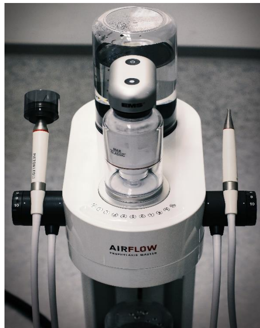
Slika 1. Strojni EMS AIRFLOW® uređaj

Procjena učinkovitosti inicijalnoga liječenja važna je za planiranje daljnje terapije i pružanje smjernica za buduće liječenje. Provodi se četiri do osam tjedana nakon inicijalnoga liječenja (22). Ako inicijalno liječenje nije uspješno, procjenjuje se postoji li indikacija za provedbu korektivne faze liječenja. Ukoliko je inicijalna faza uspješna, bolesnika se uključuje u program potporne parodontne terapije (22). Slika 1 prikazuje strojni instrument za parodontološko liječenje.