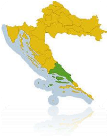
Slika 1. Republika Hrvatska sa Splitsko-dalmatinskom županijom

Podatci o ispitanicima su prikupljeni analizom pismohrane Odjela za sudsku medicinu KBC-a Split. Nakon prikupljanja podatci o ispitanicima su razvrstani prema navedenim varijablama. Tako razvrstani podatci su uneseni u Microsoft Office Excel program za Windows gdje su pripremljeni za daljnju statističku obradu.