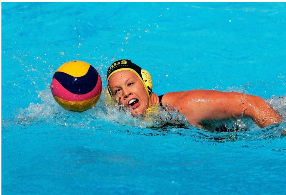
Slika 4. Dentalni štitnik kod igračice vaterpola.

Na važnost prevencije orofacijalnih ozljeda uslijed bavljenja sportom često apelira Američka akademija dječje stomatologije (engl. American Academy of Pediatric Dentistry , AAPD) te su izdane smjernice koje upućuju doktore dentalne medicine na približavanje upotrebe zaštitne opreme javnosti, ali i na suradnju s trenerima i voditeljima sportskih klubova. Najveći je naglasak zasigurno stavljen na razvoj udobnih i učinkovitih dentalnih štitnika koji bi bili dostupni amaterskim i profesionalnim sportašima (Slika 4) (28).