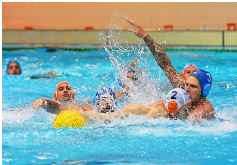
Slika 3. Intezivan fizički kontakt između dva protivnička igrača.

Zabilježeno je da su tijekom Olimpijskih igara u Ateni, 56% prijavljenih vaterpolskih ozljeda bile ozljede glave, a sve su nastale kontaktom s drugim igračem (Slika 3).