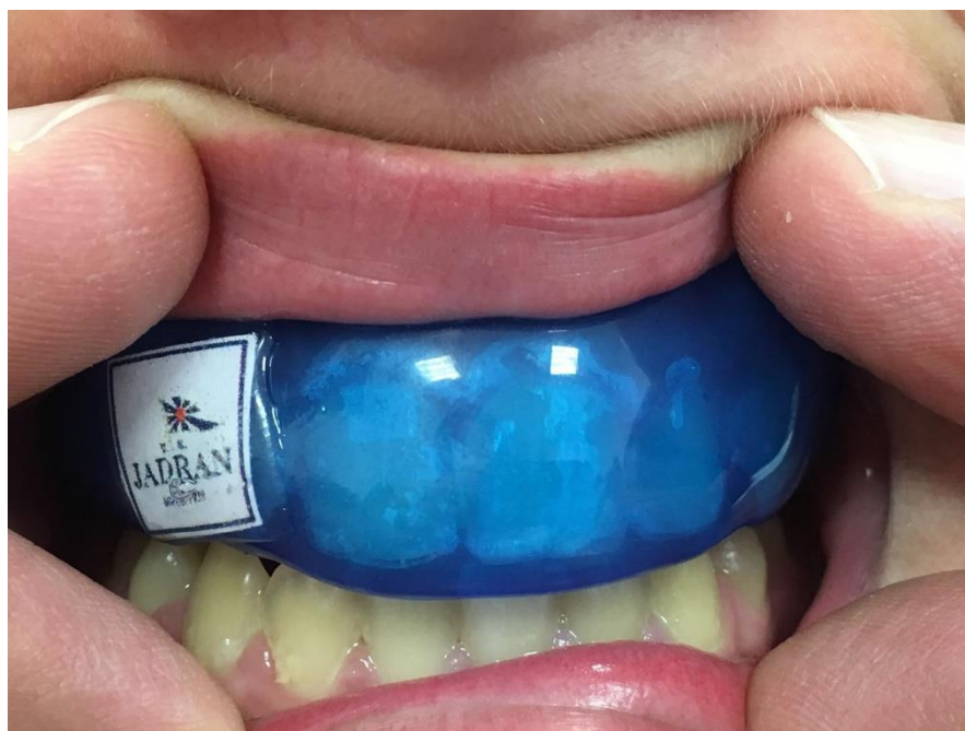
Slika 5. Individualni dentalni štitnik Playsafe Triple (Erkodent, Pfalzgrafeweiler, Njemačka).

Tri su osnovne razine prevencije orofacijalnih i dentalnih ozljeda u kontaktnim sportovima. Primarna razina uključuje postupke educiranja trenera i sportaša s rizicima, sa svrhom korištenja štitnika za lice i usta (Slika 5). Sekundarna podrazumijeva različite pristupe liječenja dentalnih ozljeda, sa primarnom zadaćom očuvanja vitaliteta zuba ili ostanka zuba u čeljusti. Tercijarna razina definira nadoknadu izgubljenog tkiva i rehabilitaciju pacijenta do stupnja gotovo normalne funkcije (29).