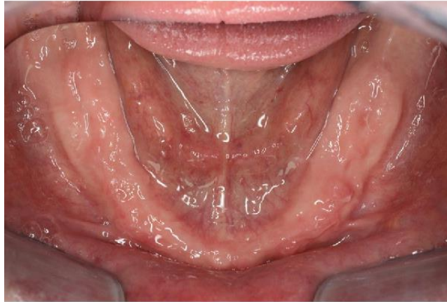
Slika 2. Ležište baze donje proteze. Preuzeto (7)

Sve navedeno dovodi do problematike u izradi kao i u postizanju retencije i stabilizacije donje proteze. Različiti oblici i specifičnosti tkiva uz površinu ležišta predstavljaju izazov u izradi potpunih proteza kako u donjoj, tako i u gornjoj čeljusti. Preduvjet za izradu proteza s dobrom retencijom i stabilizacijom je upravo dobro poznavanje anatomske i histološke građe uz sanaciju nepovoljnih oblika tkiva te primjenu posebnih tehnika otiskivanja (2,8).