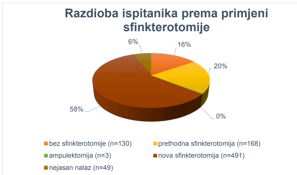
Slika 3. Razdioba ispitanika prema primjeni sfinkterotomije

Među učinjenim operativnim zahvatima, najveći udio imala je sfinkterotomija (ukupno 78%).