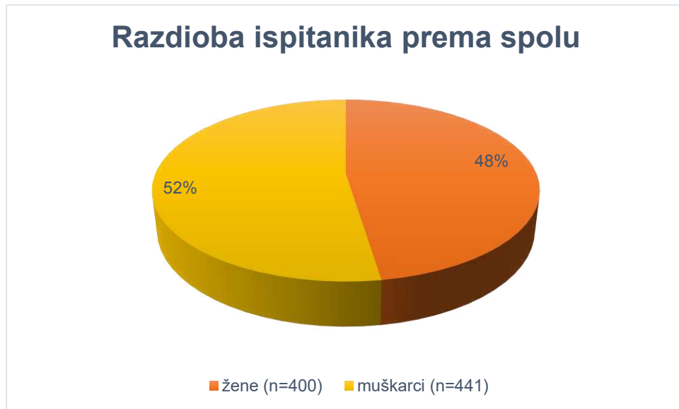
Slika 1. Razdioba ispitanika prema spolu

Medijan životne dobi ispitanika iznosio je 73 godine (Q1-Q3: 63-81; min-maks.: 20-99). Medijan životne dobi žena iznosi 74 god. (Q1-Q3: 63-82; min-maks.:20-99), a muškaraca 72 god. (Q1-Q3:63-80;min-maks.: 23-96). Između muškaraca i žena nije bilo statistički značajne razlike s obzirom na dob ( Z=1,52 ; P=0,129 ).