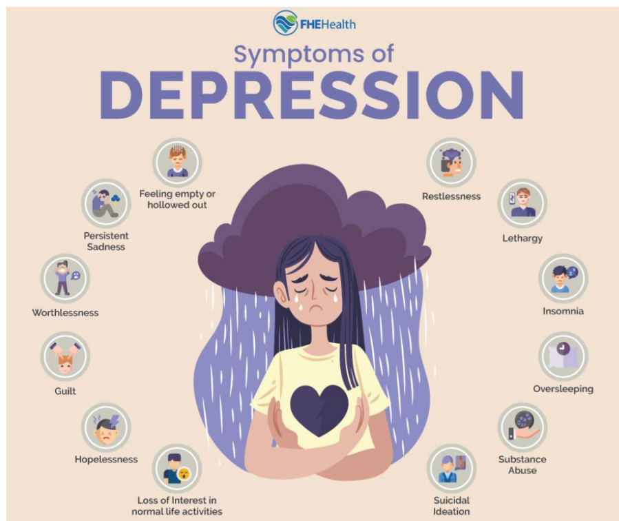
Slika 1. Slikovni prikaz simptoma depresije (10).

Depresivni poremećaj primarni je javnozdravstveni izazov koji se javlja u svakoj životnoj dobi. Ovaj kronični poremećaj znatno slabi psihosocijalnu i profesionalnu funkciju bolesnika, utječe na osjećaje bolesnika, kao i na njihovu percepciju sebe i svijeta oko sebe. Bolest se prezentira tužnim, iritabilnim raspoloženjem, anhedonijom te osjećajima beznađa, bezvrijednosti i krivnje. Prisutni su i kognitivni i neurovegetativni simptomi, kao što su poteškoće u koncentraciji, promjene pamćenja i apetita, a kod nekih su prisutne i suicidalne misli. Više od 60 % pacijenata s depresijom ima klinički značajno smanjenje kvalitete života (9).