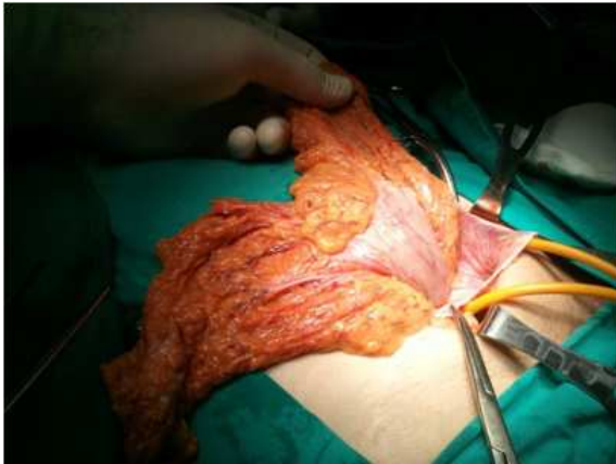
Slika 2a. Eksploracija sadržaja kilne vreće

b) TEHNIKA PREDNJEG PRISTUPA U LIJEČENJU UKLIJEŠTENE PREPONSKE KILE (slika 1)- koristi semihorizontalnu ingvinalnu inciziju kože i potkožja, kosu inciziju aponeuroze vanjskog kosog trbušnog mišića uz oslobađanje ukliještene kilne vreće u području kilnog vrata, izdvajanje sjemenskog snopa uz eksciziju mišića (m.cremaster) te prepariranje kilne vreće od elemenata sjemenskog snopa s pozornošću na očuvanje vaskularne testikularne peteljke. Kilna vreća se otvara, eksploracijom sadržaja utvrdi se vitalnost ukliještenog kilnog sadržaja (slika 2a i 2b).