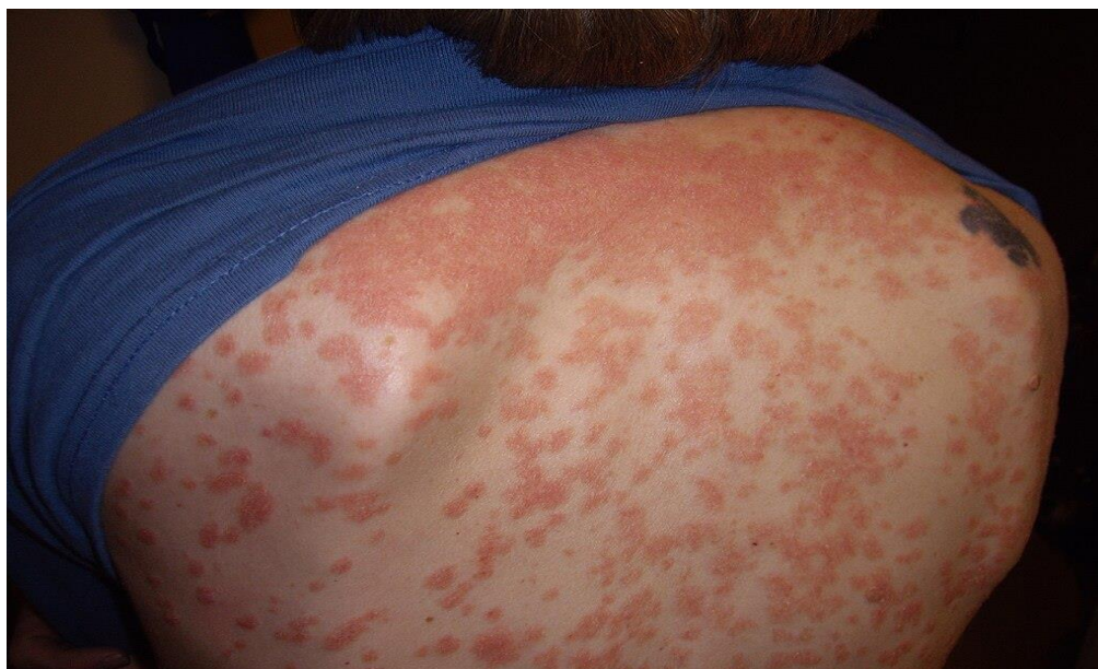
Slika 2. Prikaz kapljične psorijaze ili psoriasis guttata na leđima.