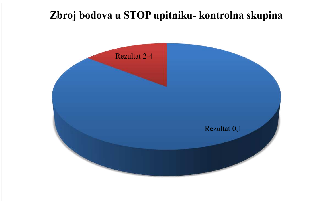
Slika 6. Grafički prikaz zbroja bodova STOP upitnika u ispitanoj populaciji bez psorijaze.