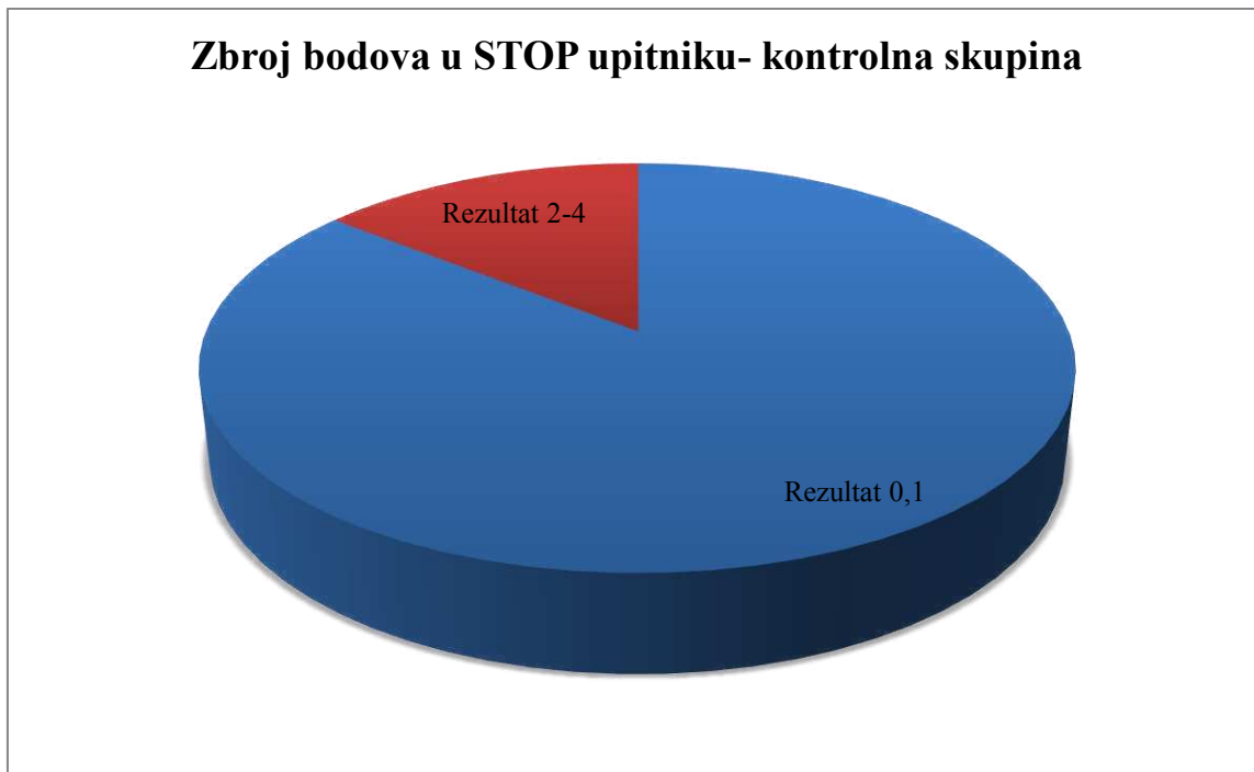
Slika 6. Grafički prikaz zbroja bodova STOP upitnika u ispitanoj populaciji bez psorijaze.