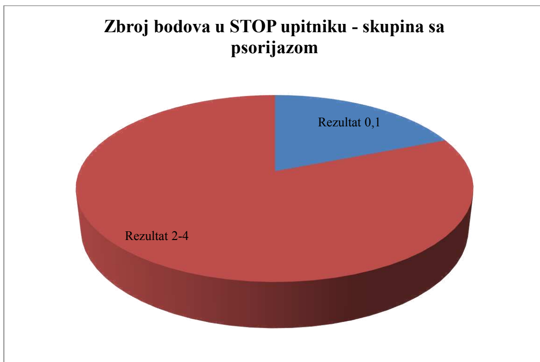
Slika 5. Prikaz zbroja bodova STOP upitnika u ispitanih pacijenata sa psorijazom.

Normalnost distribucije procijenili smo Shapiro-Wilk testom (skupina sa psorijazom P=0,004 , zdrava skupina bez psorijaze P=0,021 ). Za usporedbu vrijednosti STOP upitnik rezultata među skupinom pacijenata oboljelih od psorijaze i zdrave skupine korišten je Mann-Whitney U-test. Postoji visoka statistička značajnost razlike vrijednosti zbroja STOP upitnika pacijenata sa psorijazom u odnosu na skupinu zdravih ispitanika ( P<0,001 ). Medijan rezultata pacijenata sa psorijazom je iznosio 3,00 uz interkvartilni raspon 2,00-4,00, a zdravih ispitanika 1,00, uz interkvartilni raspon 0,00-1,00. Grafički prikaz rezultata STOP upitnika je na Slici 5, Slici 6 i Slici 7.