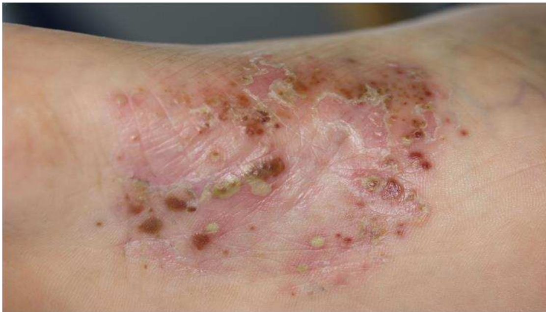
Slika 4. Prikaz papulopustulozne psorijaze. Izvor:

U slučaju kapljičaste psorijaze, kao diferencijalne dijagnoze se spominju pityriasis rubra pilaris , pityriasis rosea , subakutni lupus i sekundarni sifilis (42).