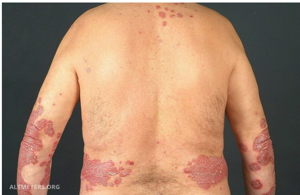
Slika 1. Prikaz vulgarne psorijaze na ekstenzornim stranama udova i lumbosakralnoj regiji.

koja nastane u skupu deskvamacije kože, stanje može rezultirati i zatajenjem srca i smrću (34).