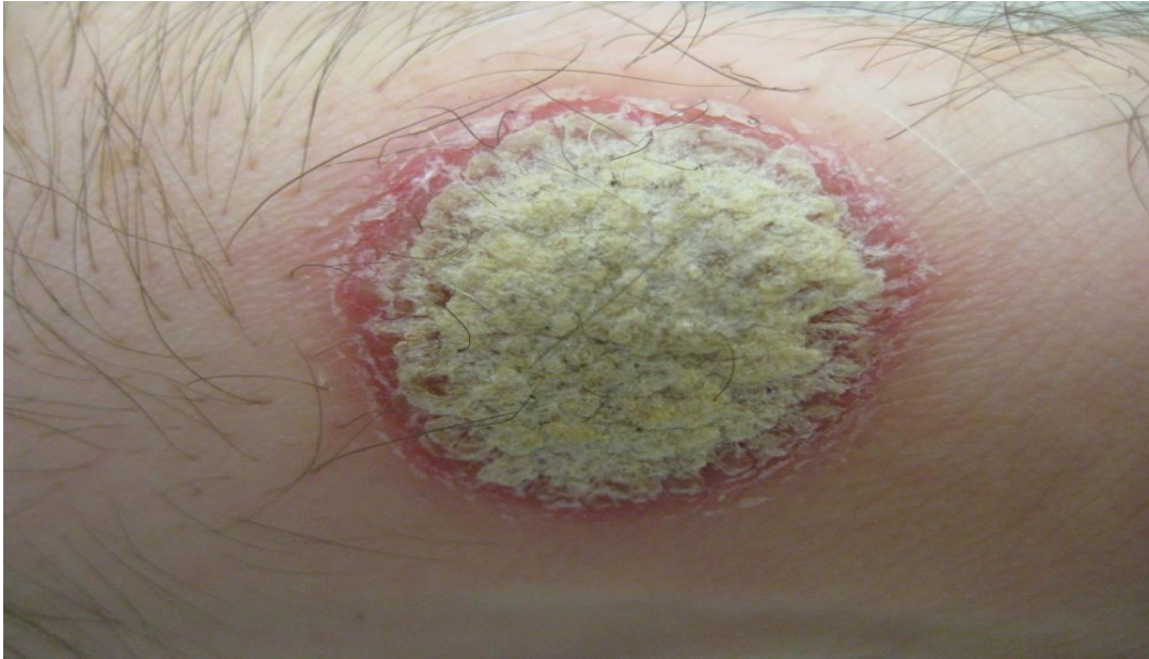
Slika 3. Prikaz psorijatične lezije u psoriasis vulgaris .