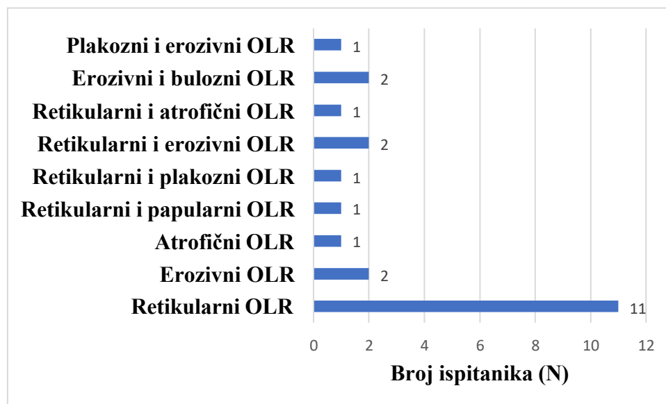
Slika 1. Raspodjela ispitanika prema kliničkom obliku OLR – a

Kod jednog ispitanika uočene su i kožne promjene koje odgovaraju kliničkoj slici lichen rubera. Nadalje, neki od ispitanika pokazuju više od jednog oblika OLR – a. Detaljna raspodjela koja taj podatak uzima u obzir prikaza je na Slici 1.