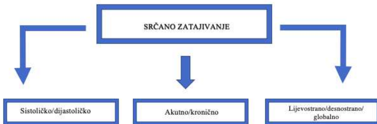
Slika 1. Podjela srčanog zatajivanja

Tradicionalno, sukladno nalazima ultrazvuka srca i istisne frakcije lijeve klijetke (LVEF), srčano zatajivanje možemo podijeliti na: sniženu sistoličku funkcija lijeve klijetke (HFrEF, LVEF \leq 40\% ), blago sniženu (HFmEF, LVEF 41-49%), i očuvanu (HFpEF, LVEF \geq 50\% ).