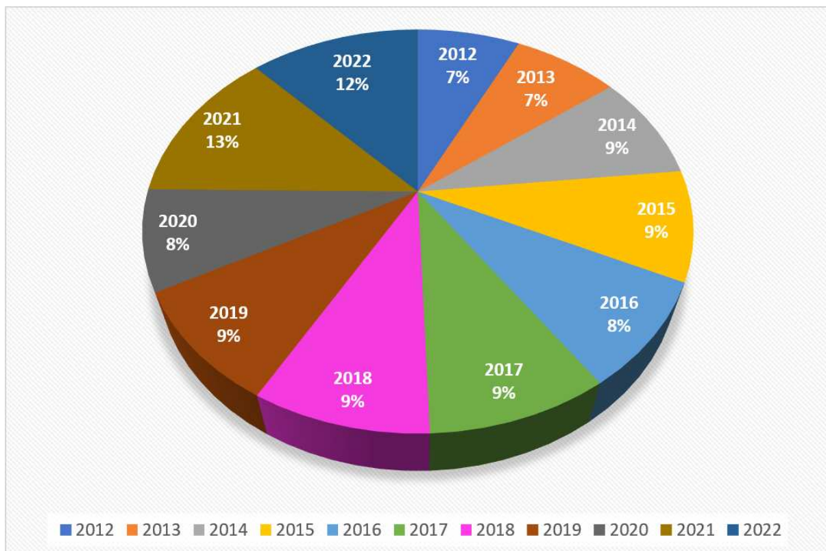
Slika 4. Udio istraživanja alternativne i komplementarne terapije depresije u promatranome periodu prema godini objave

Na Slici 4. prikazan je broj sažetaka prema godini objave istraživanja alternativne i komplementarne terapije depresije. Najveći broj, 67 i 63 istraživanja, objavljeno je u posljednje dvije promatrane godine, 2021. te 2022. godini, što ukupno čini 25% svih sažetaka uključenih u analizu. U promatranom periodu je uočen i blagi porast broja istraživanja iz ovog područja, sa 7% iz 2012. godine na 12% 2022. godine, izuzev 2020. godine, kada su objavljena 42 istraživanja (8%).