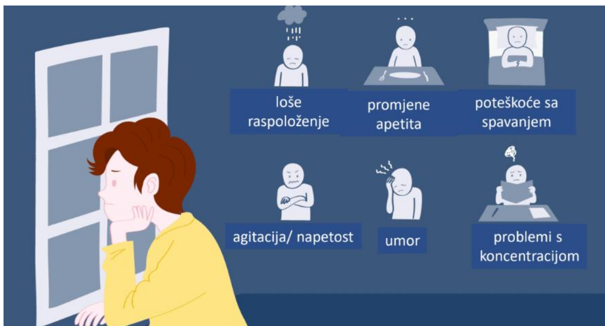
Slika 1. Shematski prikaz simptoma depresije (11).

Depresija izaziva rastrojenost čitavog organizma. Loše raspoloženje, promjene apetita, poteškoće sa spavanjem, napetost, umor i problemi s koncentracijom samo su jedni od simptoma koje uzrokuje te su prikazani na slici 1. Često je praćena i simptomima koje povezujemo s drugim psihičkim poremećajima kao što je anksioznost, što čini otežavajuću okolnost prilikom same dijagnostike. Zbog opće letargije dolazi do zapaštanja i nebrige za sebe što posljedično dovodi do pogoršanja zdravstvenog stanja i napredovanja komorbiditeta osobe (10).