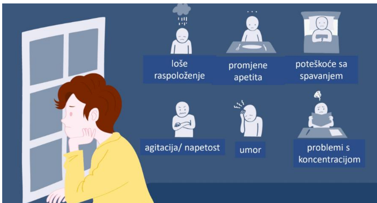
Slika 1. Shematski prikaz simptoma depresije (11).

Depresija izaziva rastrojenost čitavog organizma. Loše raspoloženje, promjene apetita, poteškoće sa spavanjem, napetost, umor i problemi s koncentracijom samo su jedni od simptoma koje uzrokuje te su prikazani na slici 1. Često je praćena i simptomima koje povezujemo s drugim psihičkim poremećajima kao što je anksioznost, što čini otežavajuću okolnost prilikom same dijagnostike. Zbog opće letargije dolazi do zapaštanja i nebrige za sebe što posljedično dovodi do pogoršanja zdravstvenog stanja i napredovanja komorbiditeta osobe (10).