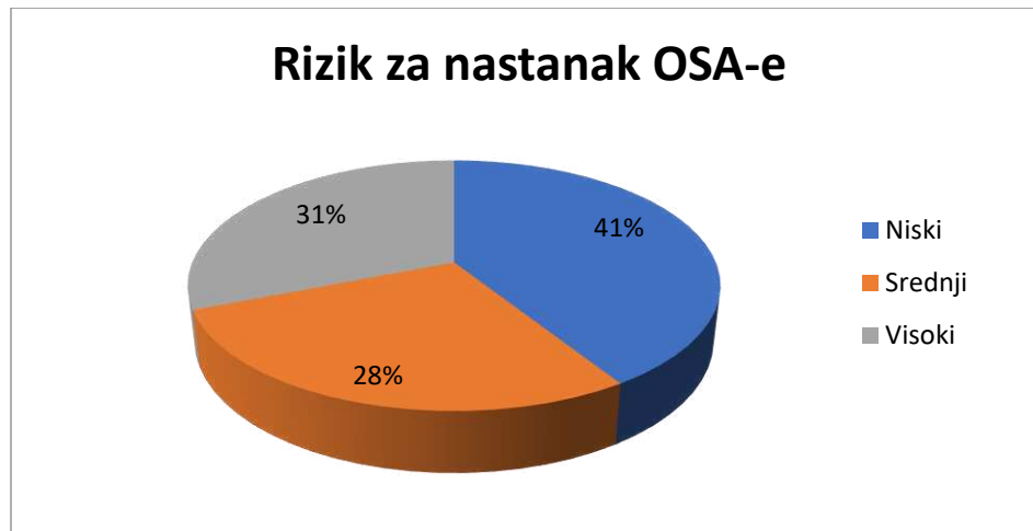
Slika 2, Raspodjela ispitanika s rizikom za nastanak OSA-e prema STOP upitniku (STOP \leq 2 niski rizik; STOP 3-4 srednji rizik; STOP 5-8 visoki rizik)

Slika 2, prikazuje raspodjelu rizika za nastanak OSA-e među ispitanicima. Najveći broj ispitanika, njih 41 (41%) imao je nizak rizik za nastanak OSA-e dok je 31 (31%) ispitanik imao visoki rizik te je 28 (28%) ispitanika imalo srednji rizik.